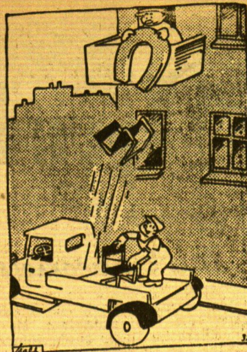
Die Umzugsleute sind Feuer und Flamme für die Mode der Stahlmöbel.

„How do you do, Mr. Vogelhuber?“ begrüßte ich ihn. „Pst!“ machte er und sah sich erschreckt um. Da aber niemand in der Nähe war, fiel er mir nahezu um den Hals. „Ich bin nämlich der Mrs. Vogelhuber durchgebrannt“, gestand er. „Fünfzehn Jahre habe ich es ausgehalten, Dora, volle fünfzehn Jahre! Wissen Sie, was das heißt? Doch jetzt ist es