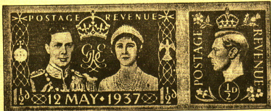
Postwertzeichen zur Krönungsfeier

In Riga fanden in der vorigen Woche die Kämpfe um die Europameisterschaft im Korfball statt, an denen Litauen, Lettland, Estland, Polen, die Tschechoslowakei, Ungarn, Frankreich, Italien und Ägypten teilnahmen. Die litauische Mannschaft blieb während der ganzen Spiele unbesiegt und errang sich in einem Schlussspiel gegen Japan den Titel eines Europameisters.