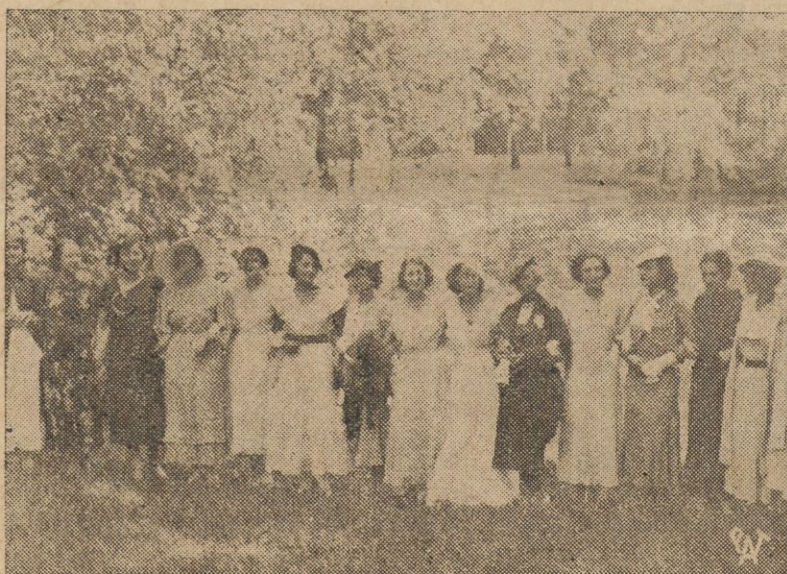
Piękności z różnych krajów europejskich po śniadaniu wydanem na ich cześć przed wy-

jazdem do Hastings w Anglii, gdzie dokonany będzie wybór Miss Europy na r. 1934.