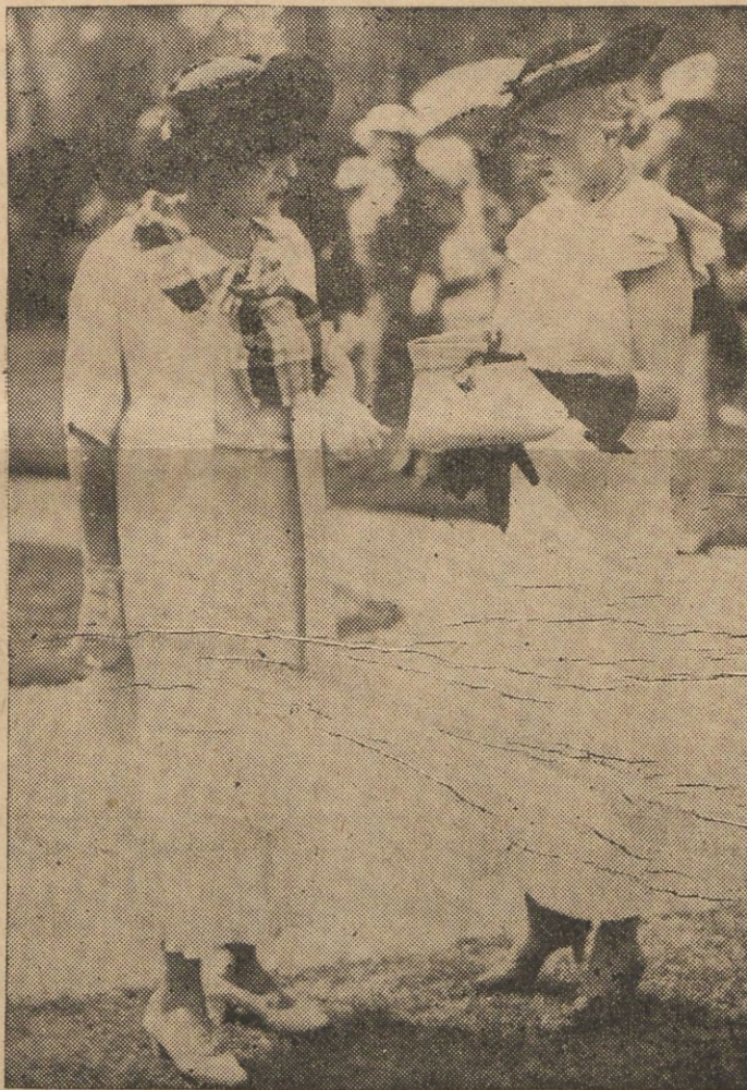
W słynnej kąpielowej miejscowości francuskiej w Deauville odbył się ostatnio pokaz

mód, który ściągnął tłumy widzów. Na zdjęciu nagrodzone kreacje.