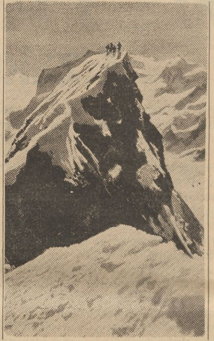
Alpiniści na Matterhorn, niebezpiecznym szczycie Alp, pomiędzy Szwajcarią a Włochami, którego zdobywanie kosztowało w ciągu lat wiele ofiar ludzkich, niedawno także czterech Włochów.