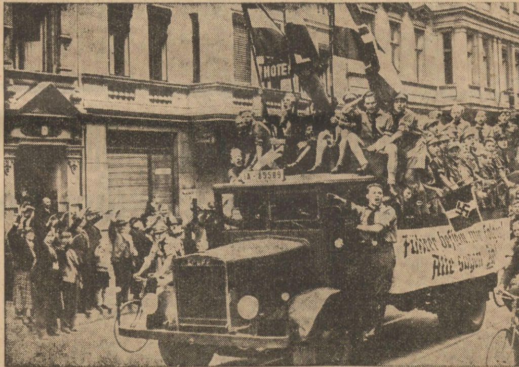
!Po plebiscycie w Niemczech z ub. niedzieli propaganda nie ustala. Hitler postawił sobie za zadanie pozyskanie tych 4 milionów oby-

wateli Rzeszy, którzy w plebiscycie głosowali „nie“.