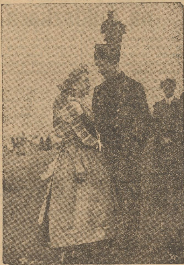
Reprodukujemy zdjęcie, przedstawiające dorodną parę ze Śląska, w śląskich strojach ludowych, podczas Kongresu młodzieży wiejskiej.