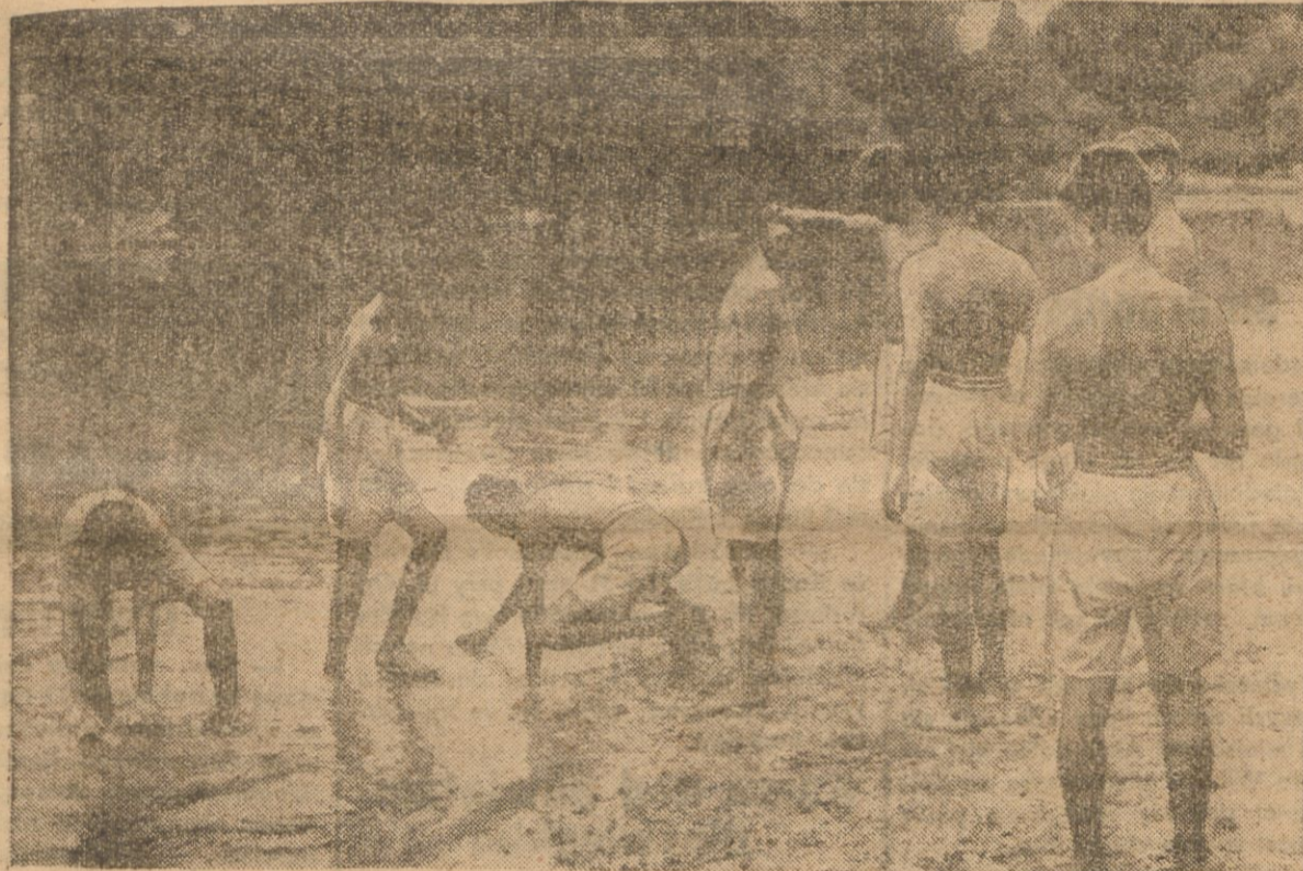
14-letni król Jugosławii, Piotr II, swój urlop spędza w obozie harcerskim w letniej rezydencji królewskiej w Suvogar. Na zdjęciu — król w otoczeniu rówieśników podczas kąpeli.