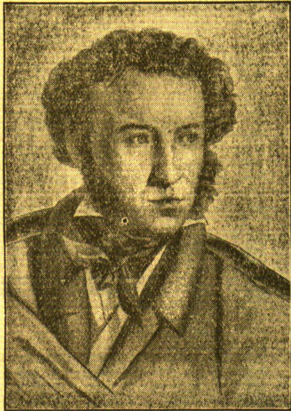
Alexander Sergejewitsch Puschkin

Der Ueberfall kam nicht unerwartet. Der Poli-