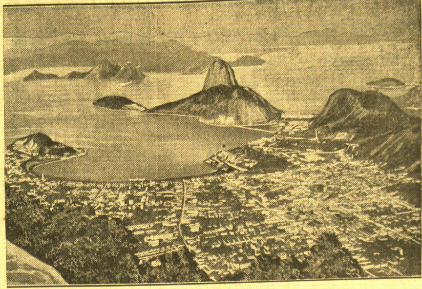
So sahen die Fahrgäste des Luftschiffes „Hindenburg“ das Ziel ihrer Südamerika-Reise