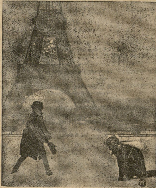
Rzuł oka na wież Elifla w zimowej szacie