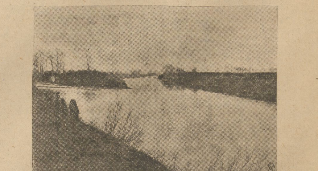
Nad rzeką Olzą w pobliżu Mysłowic schodzą się granice Polski, Czechosłowacji i Niemiec. Teren ten zwano dawniej „Trójkątem trzech cesarzy”, schodziły się tu granice trzech cesarstw: Austrii, Niemiec i Rosji. Dzisiaj w punkcie tym zbiegają się granice trzech wolnych i niepodległych republik.