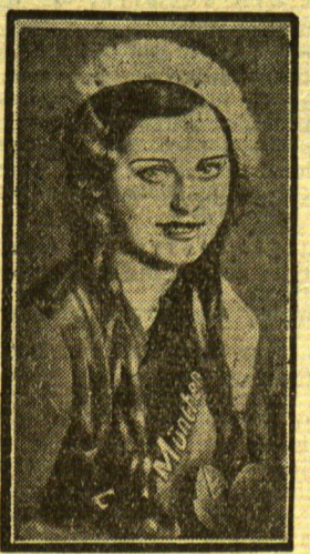
Fräulein München 1932

Natürlich hat die Rücksicht auf den Preis eine verhältnismäßig enge Begrenzung des Inhalts notwendig gemacht. Mancher mag deshalb diesen oder jenen Ernährungswunsch haben. Trotzdem gewährt die Zusammenstellung für die wichtigsten Zufälle des täglichen Lebens völlig ausreichende Hilfe. Lei er konnten aber so notwendige Dinge wie Priechnitzumschläge (Hals-, Leibwidel usw.) ihres zu großen Umfanges halber nicht mit untergebracht werden. Wenn sich das Bedürfnis zeigt, beabsichtige ich noch einen besonderen „Arzneifasten“ zusammenzustellen, der in ähnlicher Weise wie der Schrank, d. h. übersichtlich und mit zweckentsprechenden Erläuterungen versehen, die etwas mehr Raum erfordernden Geräte aufnimmt, außer den Umschlägen z. B. auch eine Spülkanne mit Schlauch, Leibwärmflasche, größere Vorräte an Watte, u. U. auch Verbandstüchern und dgl. Beides zusammen wird dann die vollständige Ausrüstung ergeben, wie sie die Hausfrau von heute für den „neuen Haushalt“ braucht.