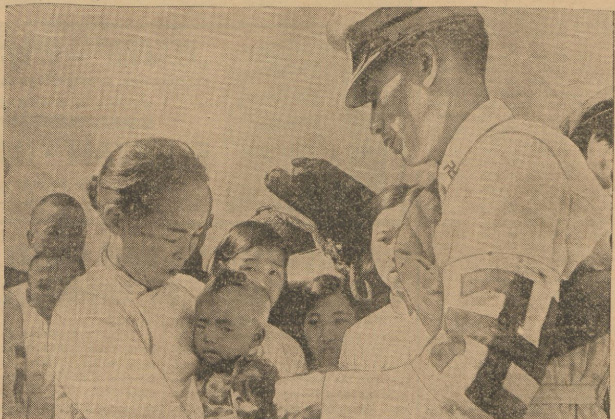
Chiński sanitariusz ze swastyką — starym symbolem buddyjskim — na rękawie —udziela pomocy małym Chińczykom i Chinkom w Szanghaju.