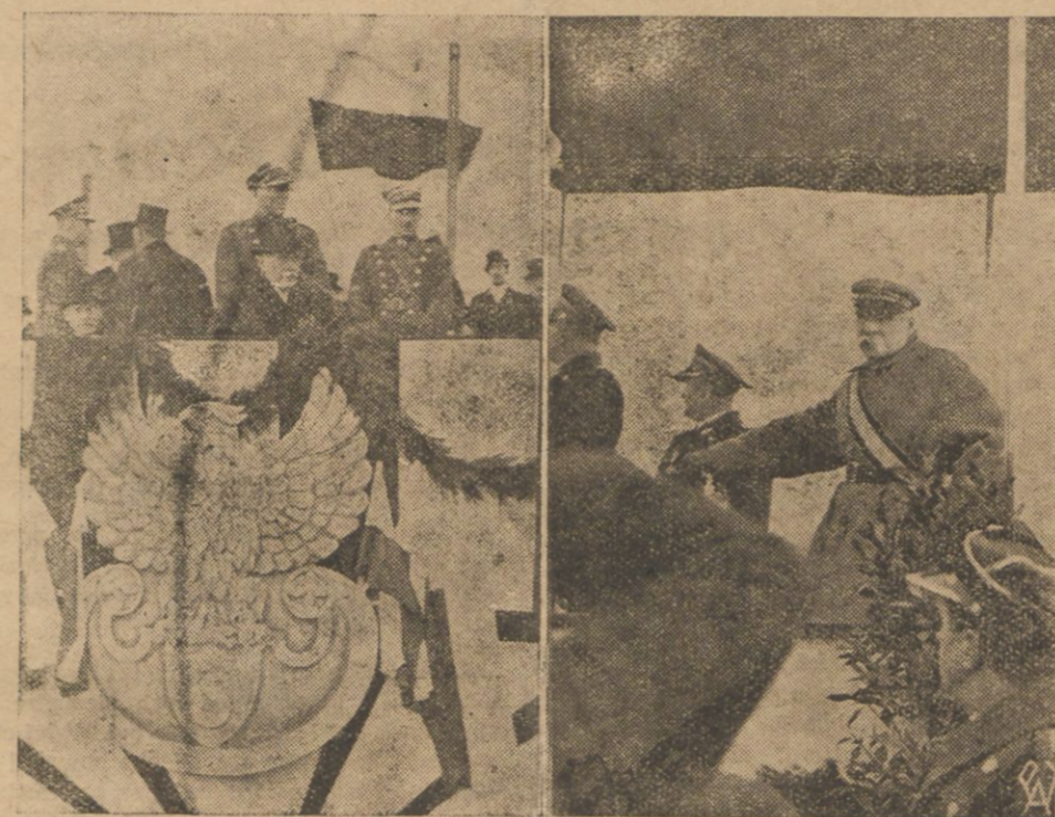
Na lewo Pan Prezydent Rzeczypospolitej prof. Mościński w swej łoży podczas rewji na Placu Mokotowskim w dniu święta 15-lecia Niepodległości. Na prawo P. Marsz. Piłsudski przyjmując defiladę na polu Mokotowskim