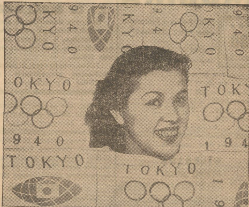
Japończycy, pomimo wojny w Chinach, nie zaniebują wielkiej propagandy na rzecz swego kraju — dowodem tego jest przeprowadzana na szeroką skalę reklama najbliższej Olimpiady, która ma się odbyć w Tokio w roku 1940.