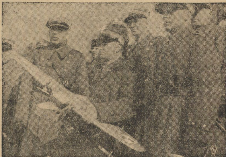
1-szy Pułk Lotniczy w Warszawie ofiarował Panu Marszałkowi Piłsudskiemu w dniu Jego imienia precyzyjnie wykonany model samolotu. Na zdjęciu — delegacja 1-go Pułku Lotniczego z d-ęcą Pułku na czele przybyła do Belwederu celem wręczenia daru.