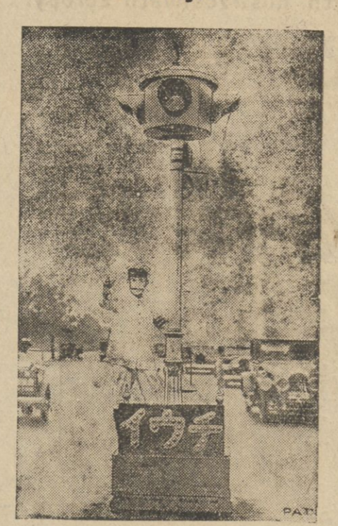
Ilustracja przedstawia policjanta japońskiego, kierującego za pomocą sygnału świetlnego ruch na jednej z głównych ulic stolicy państwa Wschodzącego Słońca