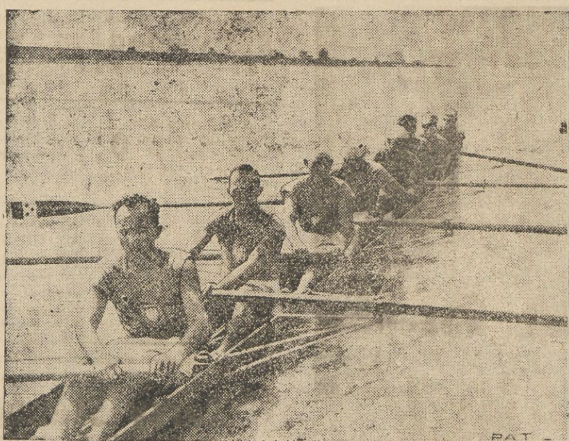
W dniach 2, 3 i 4 września rozegrane zostały w Białogrodzie mistrzostwa Europy w wioślarstwie.