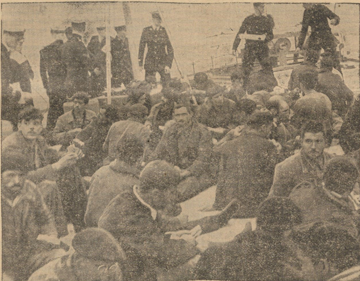
Podczas gdy wojska gen. Franco w szybkim tempie posuwają się w kierunku Barcelony, z czerwonej Hiszpanii morzem i lądem ciągną tysiące uciekinierów. Na zdjęciu transport b. żołnierzy armii marksistowskiej na pokładzie angielskiego okrętu wojennego.