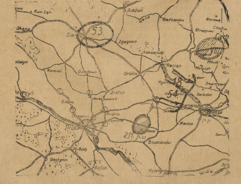
211 pułk ułanów według planu sytuacyjnego z dn. 16-VIII godz. 12 w południe. W obwodach kreskowanych — wojska polskie; czarnych — bolszewickie.