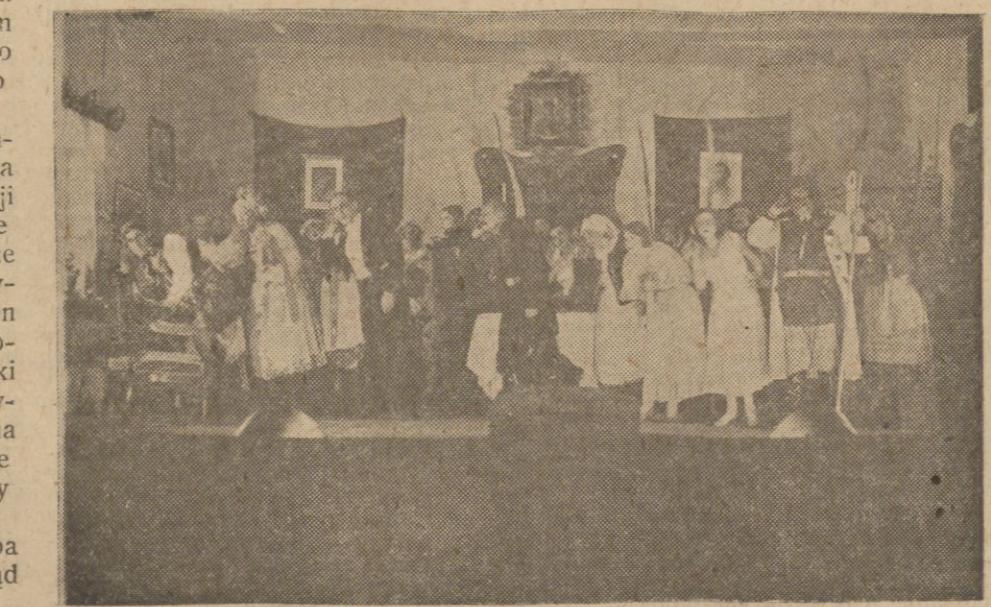
„Wesele” Wyspiańskiego na scenie teatru w Grodnie.

stawie. Wyżsi urzędnicy i wojskowi nie łaskawi są podobno na teatr miejscowy. Istnieje bowiem niestuszny przesąd, że teatr w małym mieście musi być gorszy, niż w większym. Tymcza-