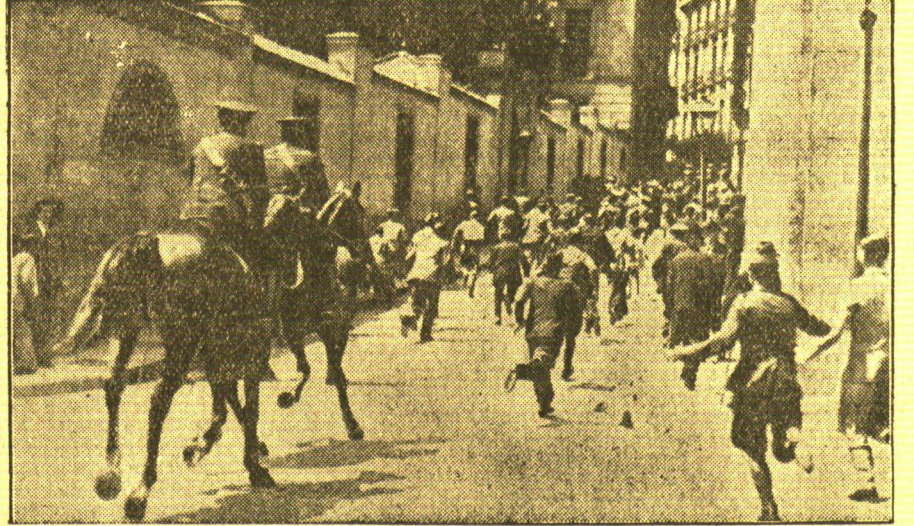
Bilder aus Abdis Abeba vor den Unruhen

Unser Bild zeigt links den Bahnhof von Abdis Abeba, wo sich einige Europäer verschanzt hatten, und (Mitte) den Kaiserpalast, der von den Aufständischen geplündert worden und zum Teil ausgebrannt ist