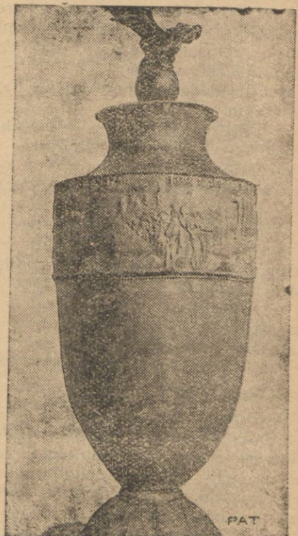
Fotografia nasza przedstawia piękną wazę, którą w dniu 1 października p. minister Zaleski wręczył uroczyste rządom szwajcarskim z okazji 100-letniej rocznicy przekroczenia granicy szwajcarskiej przez niedobitki polskich pułków powstańczych i gościnności przyjęcia ich przez Szwajcarię. Płaskorzeźby na wazie przedstawiają grobowiec Kościuski w Solurze oraz scenę przejścia polskich żołnierzy przez granicę helwecką. Waza umieszczona zostanie w przedsiobku parlamentu w Bernie.