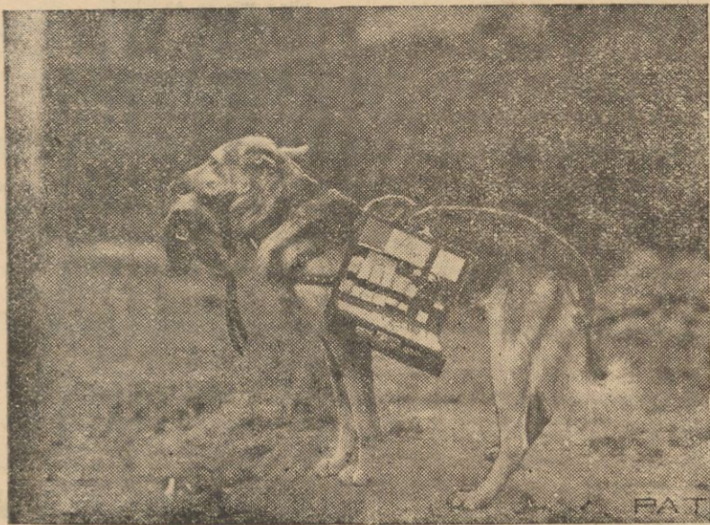
Oto pies wyszkolony do noszenia, zaskoczony przez napad gazowy ludności, środków leczniczych.