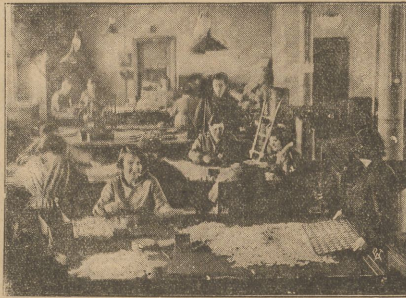
Ostatnią fazą bicia monet w mennicy jest sprawdzanie ich tak co do jakości wykonania, co do wagi i dźwięku. Czynności te wykonuje kilkadziesiąt osób. Na zdjęciu naszym widzimy jedną z sal mennicy warszawskiej, w której kilkanaście pracownic i pracowników bada wybite monety