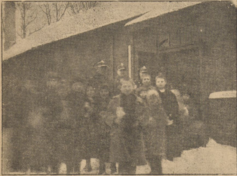
Dzietki wychodzące z Domu Żołnierza 86 p. p. w Molodecznie po otrzymaniu podarków.