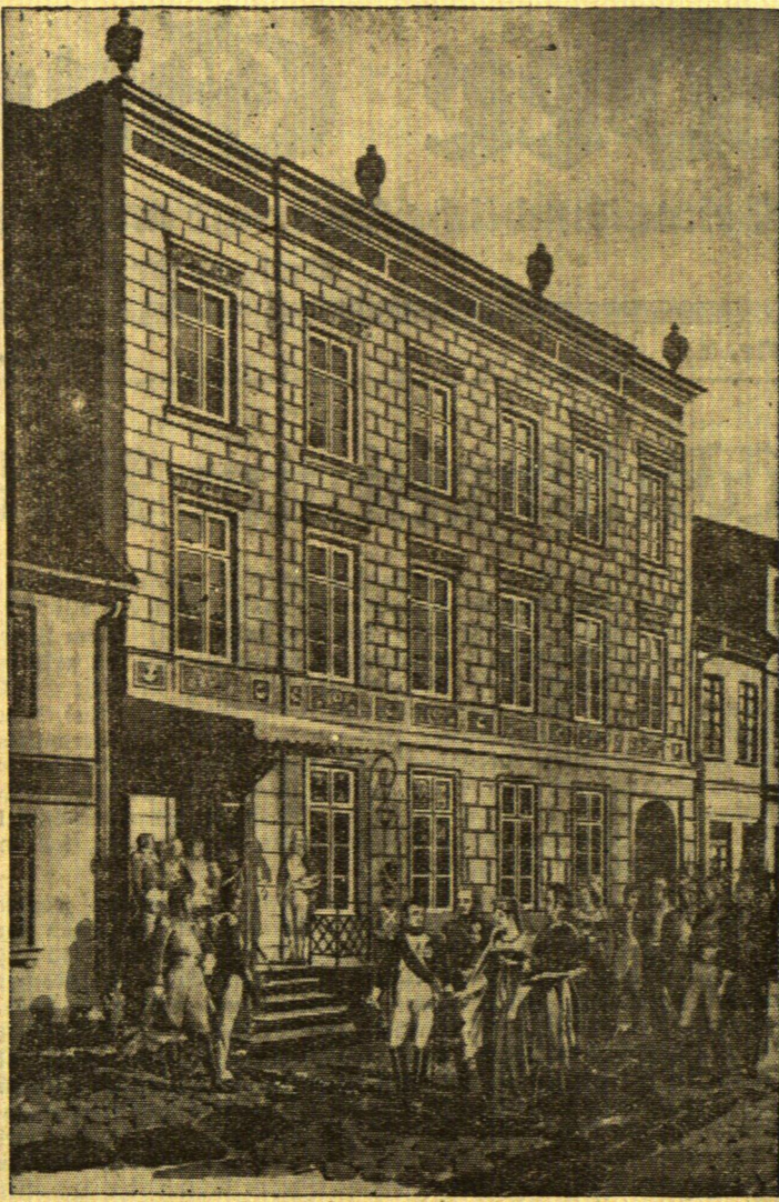
Das Napoleon-Haus an der Deutschen Straße in Tilsit

Im Jahre 1785 zählte man in Gut und Dorf Wischwill 506 Seelen, darunter waren 260 männlichen und 246 weiblichen Geschlechts.