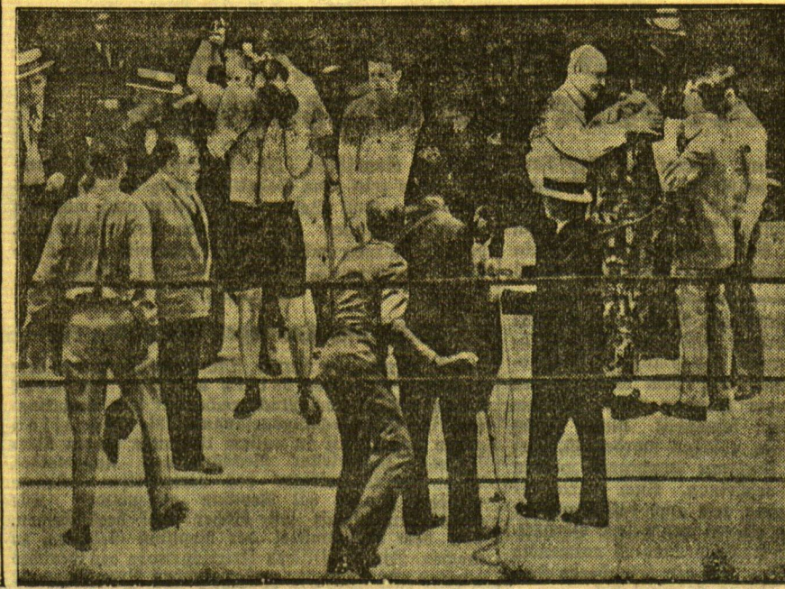
Einige der ersten Bilder vom Weltmeisterschaftsturnier „Poseidon“

Wimbledon erlebt in diesen Tagen, wie alljährlich, seine Sensation: Die Weltmeisterschaften im weißen Sport werden ausgetragen. Von Jahr zu Jahr sind die Zuschauerzahlen zu dieser gewaltigen Schau der besten Tennisspieler der Welt gestiegen. Bei den diesjährigen Kämpfen war der Anmarsch geradezu unglücklich, und es ist Zeit, daß der M.-England-Club daran denkt, die Anlagen zu vergrößern. Fast an allen Tagen war die Königsloge voll besetzt; zu den Hauptkampfzeiten weichte auch das Königspar unter den Zuschauern. So hat das Königspar fast drei Stunden in der Hofloge gesessen, um dem sensationellen Match, das sich vorortra, der „Mittigen Waise“, und der Deutschspanier Mater lieferten, zuzusehen. Der roitra übermüdet und arbeitsüberlastet war nur noch ein Schatten seiner selbst, und wurde mit Triebschlägen von enormer Länge und Fahrt von seinem Gegner mit 3:6, 3:6, 6:2, 2:6 aus dem Nennen geworfen. Mit der Niederlage vorortra war das geradezu sensationelle Ergebnis zustande gekommen, daß sich unter den letzten Weltkennern ein Franzose mehr befand. — Zum ersten Male seit einem Jahrzehnt, Wendepunkt in Weltkennis? Als weitere außerordentliche Ueberraschungen müssen die Niederlage des favorisierten Engländer's Peru angesehen werden, der nach heldenhaftem Widerstand dem Australier Crawford mit 7:5, 8:6, 2:6, 8:6 unterlag, und der Sieg „Bunny“ Austin über den holländischen Schiedsrichter.