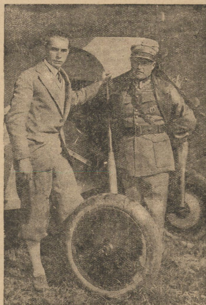
Por. Żwirko i inż. Wigura przed swoim samolotem R. W. D. 6.

Nieustająca, potężna jest mowa życia, straszliwa, zarówno w swojej potędze, jak pięknie, jest wymowa śmierci. Dzisiaj rok mija od chwili, w której wszystkie chorągwie Rzplitej zsunęły się do połowy swych masztów. Wszysey to pamiętamy. W pamięci, jak rozpalonym żelazem, chwila ta wypisała nam słowa „Żwirko i Wigura nie żyją!“ Wymowa tej śmierci walała się na nas ciężarem nie do zniesienia, tem większym, że przecież tuż przedtem byliśmy u szeptu radości i dumy. Zwycięstwo! Zwycięstwo! Młode lotnictwo polskie okryło się sławą. Zdobyło podziw nawet największych wrogów. Gdy bezpośrednio po najradośniejszych manifestacjach zburzył wspaniały pałac naszego zachwyty, grom katastrofy w Cierlicku, zdawało nam się, że razem z naszymi orłami spadliśmy z pod nieba na owe tragiczne dziś swierki lasu pod wsią morawską. Ze to my mamy również coś w naszych pierśsiach strzaskane. Bo w chwilach podobnych do tamtej, silniej niż wstydzie inne uderza moment beznadziejności. Razem z szczałkami obu lotników i ich świętego pilotowca znalazło się wtedy nam wszystko cośmy zdobyli — w gruzach.