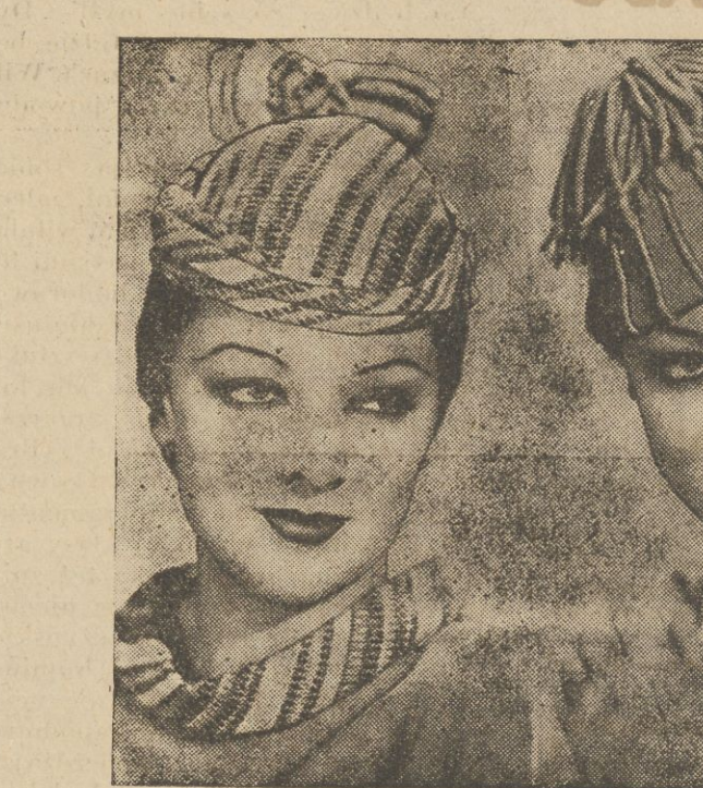
Te małe kapelusiki ledwo trzymające się na głowie to ostatnia kreacja eleganek nowojorskich.