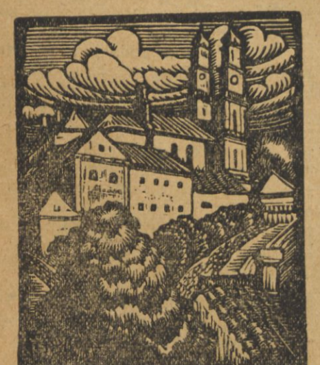
Zmniejszony więcej niż do połowy drzeworyt R. Jakimowicza z cyklu „Kościoty Wilenskie“.

„Obok życia“ „Sztandar na maszcie“ do zatytułowania swojej, świeżo wydanej u Gebethnera i Wolffa, książki o Brazylii: „Ziemia Świętego Krzyża“