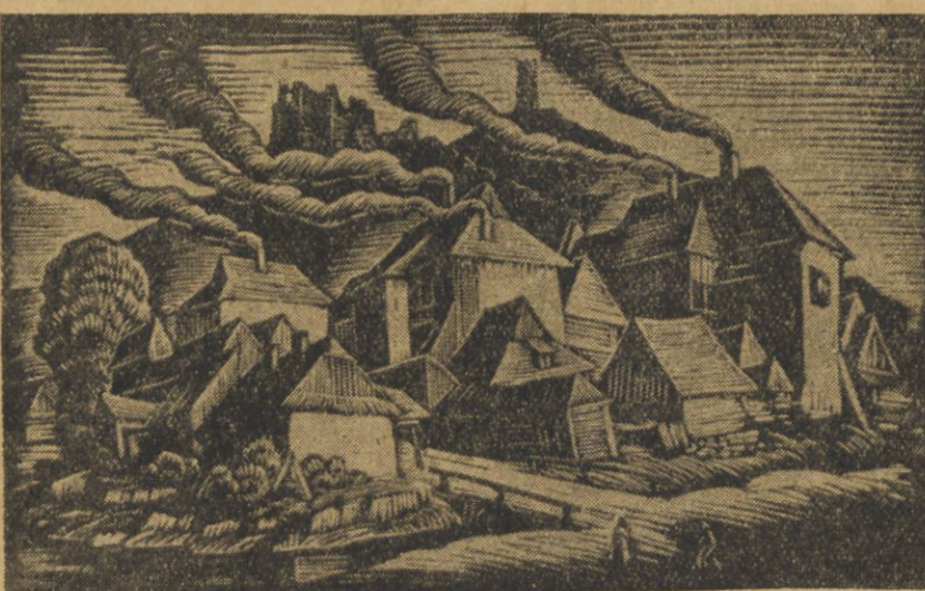
Drzeworyt W. Skoczylasa.

dziedzicznych kapitanij pobrzednych, wgląd zaś lądu każdy „kapitan“ miał prawo do takiego obszaru — jakki zdobył. Do dnia dzisiejszego wielki kontrast między „pobrzeżem“ a „interiorem“ kraju. Stan Parana, zwłaszcza jego stolica Kurytyba, to główny teren emigracji polskiej! Polacy stanowią tam 10 proc. ogółu ludności. Emigrację polską znajdujemy i w pasie nadmorskim i w głębi kraju, w „interjerze“. Przeważnie w głębi kraju. W pasie nadmorskim istnieje jedna tylko kolonia polska. Tedy należy mieć na uwadze, że Polaka