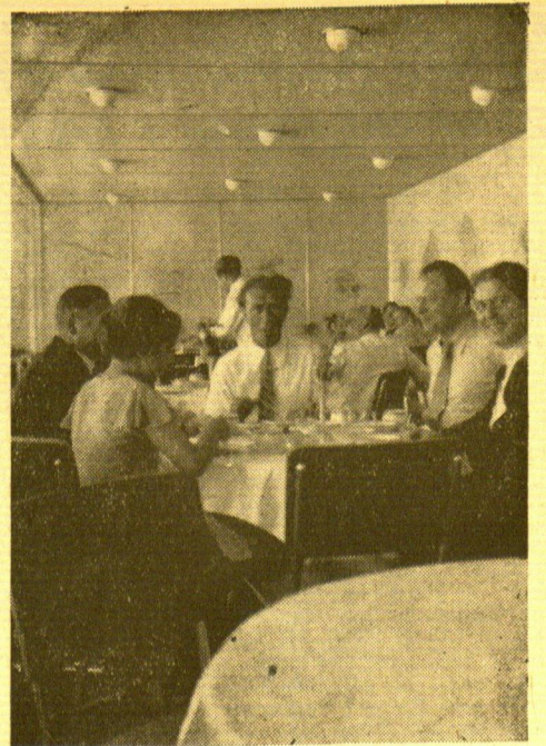
Kaffeeafel an Bord des „Hindenburg“

Schon von weitem blinzt uns der Scheinwerfer der Festung entgegen: „Was für ein Schiff?“ — „Luftschiff Hindenburg!“ — „Gute Fahrt!“ — Die Straße von Gibraltar ist frei und damit auch das Mittelmeer. Hellerleuchtet ist der mächtige Hafen: