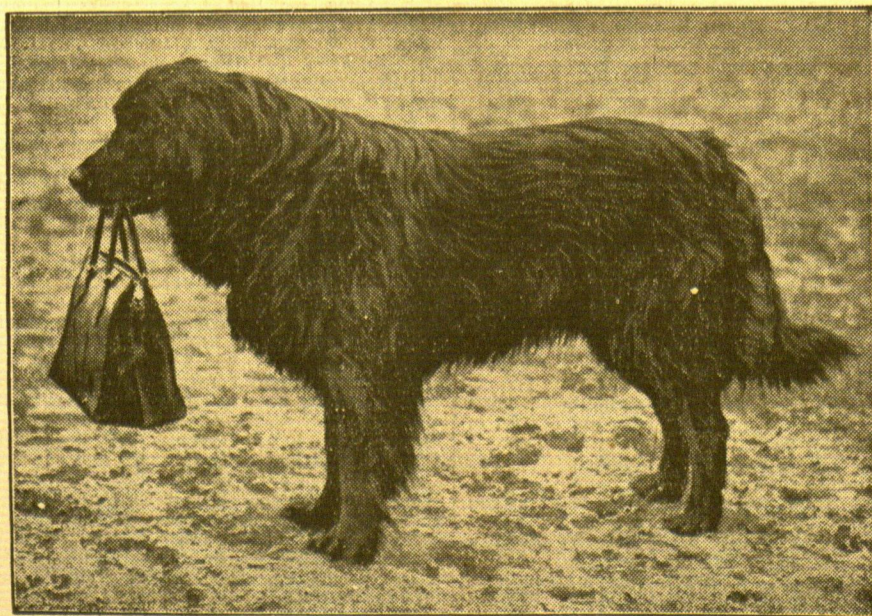
Frauchens „treuer Gefährte“

Man beschränkt sich heute darauf, die Rolle hervorzuheben, die Los Angeles als Brennpunkt des südkalifornischen Kulturkreises spielt. Man gibt ohne weiteres zu, daß kaum eine Stadt Amerikas mit einer solchen Intenität und — Dauerhaftigkeit emporgewachsen ist wie Los Angeles. Der Vorteil lag eben darin, daß nicht nur der Südrückebau und die Dichtkultur eine dauernde Verbindung mit der weiteren Umgebung notwendig machte, sondern nach und nach 1 100 Petroleumquellen angebohrt werden konnten. Diese letztere Zahl ist übrigens in einer dauernden Zunahme begriffen. Endlich kommt hinzu, daß Los Angeles heute mit zehn größeren und ebensoviele kleineren Eisenbahnen verknüpft ist und somit zusammen mit seinem Hafenplatz San Pedro, der auch mittelgroße Schiffe aufnehmen kann, stark mit der Weltwirtschaft verflochten ist, eine Verflechtung, bei der man sogar die „1000 toten Laster“ vergißt.