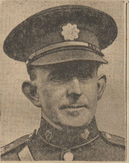
Gen. O'Duffy, przywódca „Niebieskich Koszul”.

Gen O'Duffy uciekł z Irlandji. Zamach na Cosgrave. LONDYN (Pat). Na byłego premiera Cosgrave'a, gdy przejeżdżał samochodem w hrabstwie Donegal, dokonano nieudanego zamachu, który został udaremniony przez jadących w drugim samochodzie detektywów. Przyjścieli strzelali namaszyni rzućili się do ucieczki. General O'Duffy, przy