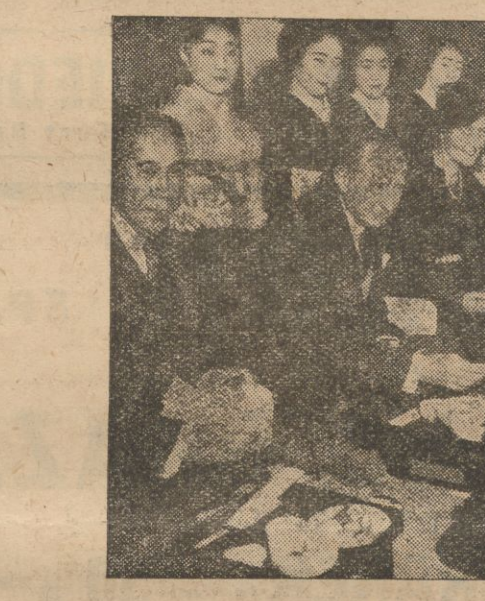
Wynalazca radja sen. Marconi w drodze z Ameryki przybył do Japonji, gdzie jest podejmowany z wszelkimi honorami.

Na zdjęciu sen. Marconi z małżonką na jednym z przyjęć, wydanych w Tokio na jego cześć. Przyjęcie utrzymane zostało ściśle w charakterze tradycji japońskiej. Znakomtemu wynalazcy usługują nadobne gejsze.