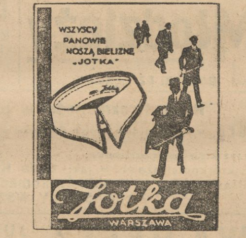
Do nabycia w pierwszorzędnym magazynie galanteryjnym