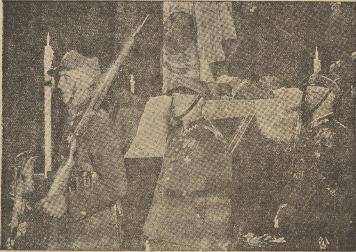
Trumna Marszałka w wielkim salonie Pałacu Belwederskiego