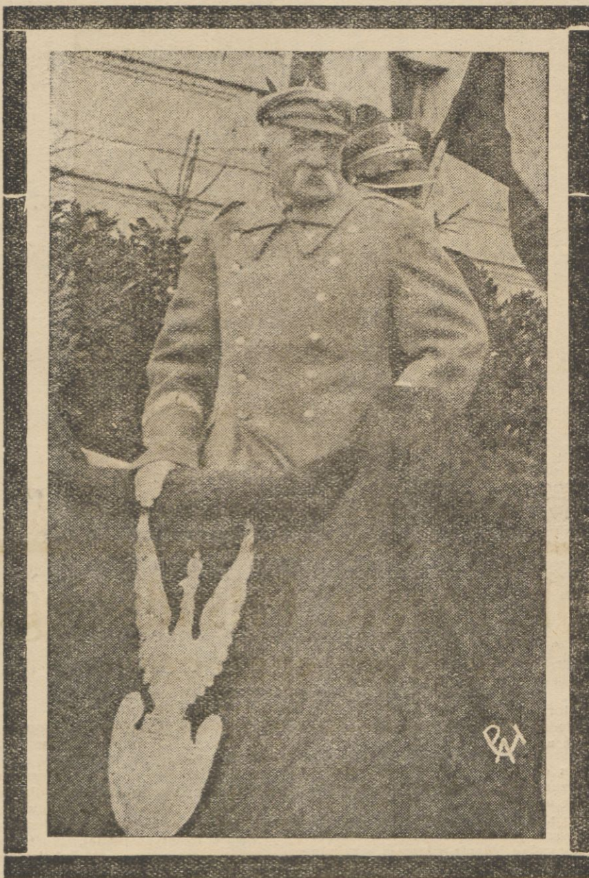
Marszałek przyjmuje w r. 1933 ostatnią defiladę w Wilnie