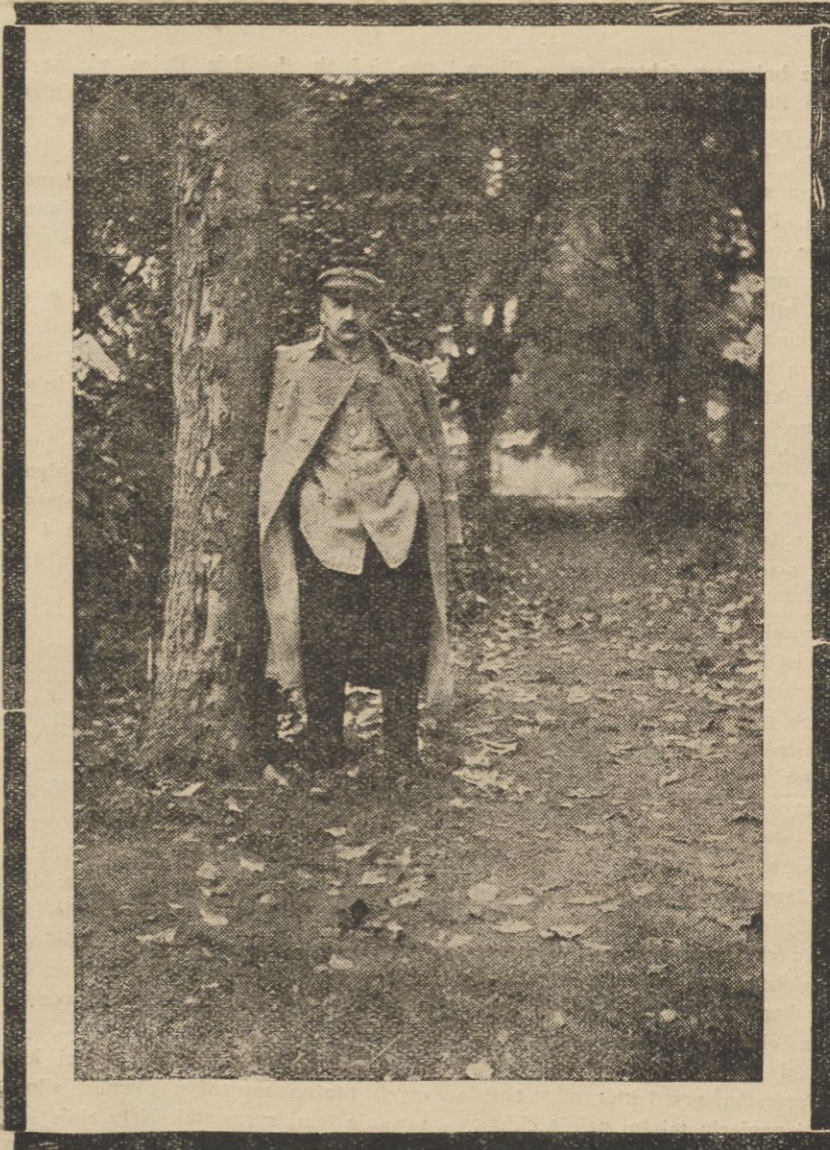
W parku w Sulejówku

Poza oficjalną delegacją Wilna w liczbie 150 delegatów, wyjechało wczoraj i wyjedzie dzisiaj bardzo wiele osób.