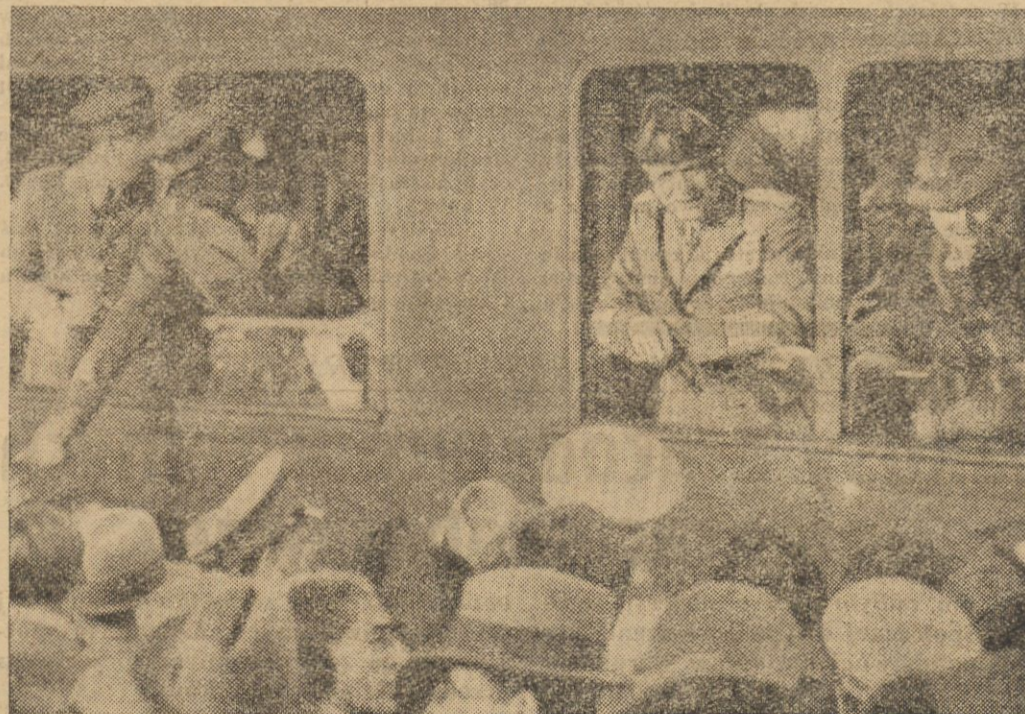
Odjazd marsz. Badoglio do Afryki Wschodniej.

O ruchach poszczególnych części armji włoskiej na froncie północnym źródła włoskie donoszą, że płk. Mariotti podjął na spotkanie z armją rasa Kassy. Korpus askarysów w dalszym ciągu oczyszcza Geralte. Pierwsza dywizja czarnych koszul dotarła do Mat Zangu a trzecia dywizja do Momo-Galila.