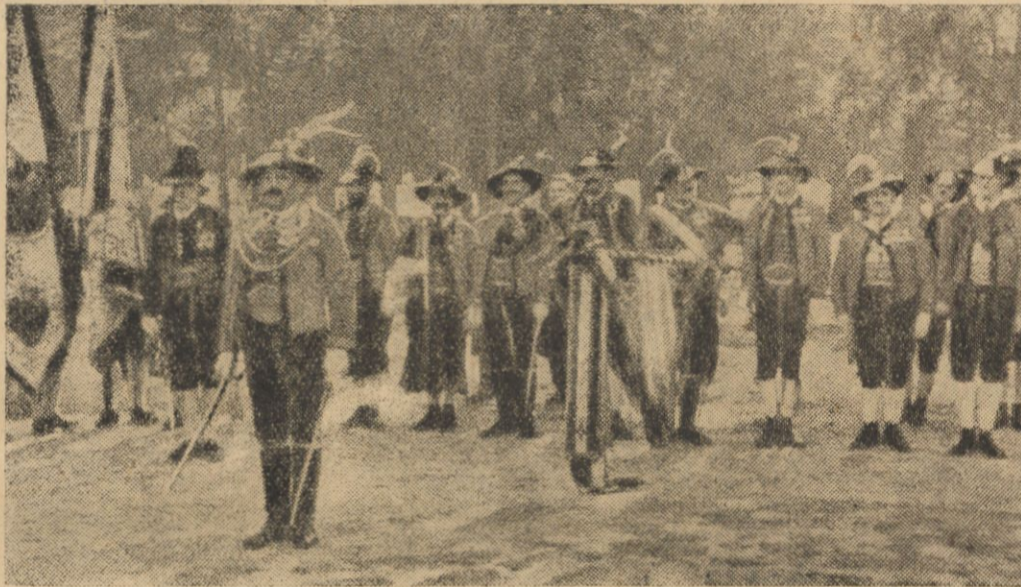
W Szwajcarii niedawno obchodzono 125 rocznicę stracenia w Mantui, z rozkazu Napoleona, obrońcy wolności Szwajcarów, Andrzeja Hofera. Na ilustracji — obchód na górze, gdzie odnieśli nad Francuzami zwycięstwo.