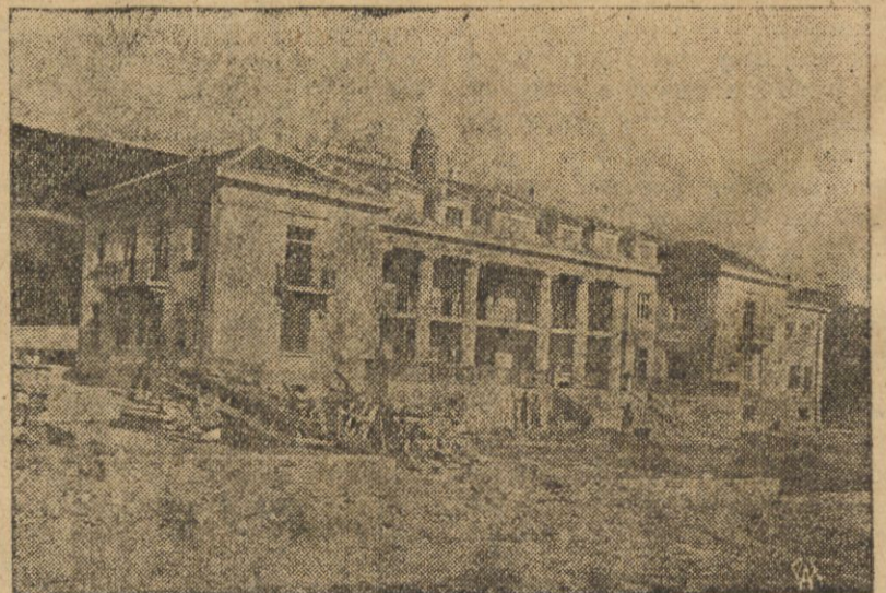
Domu Związku Polskich Pracowników Samorządowych w Warnie w Bułgarii.