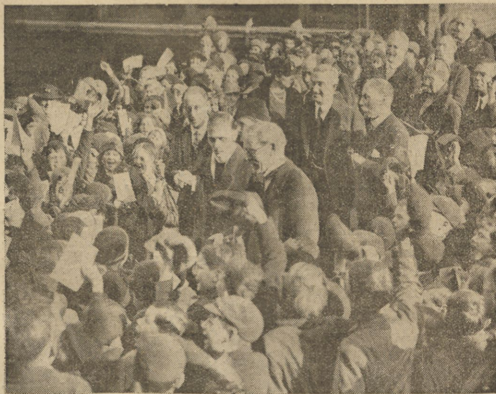
W tych dniach znana szkoła Oxford-Garden w Kensington (Londyn) obchodziła swój jubileusz. Na jubileuszu był obecny premier angielski Mac Donald, osobiście zaproszony przez uczniów szkoły.