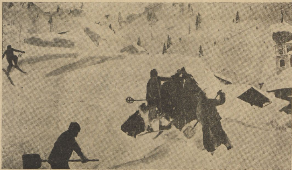
W Tyrolu spadł tak duży śnieg, że małe domki zasypał po dachy. Na ilustracji odkopywanie takiego domku.