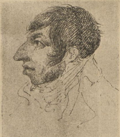
Autoportret Rustema, rysunek piórkiem w zbiorach Biblioteki Wróblewskich.

W czerwcu 1835 roku zmarł Jan Rustem, profesor rysunków i malarstwa U-