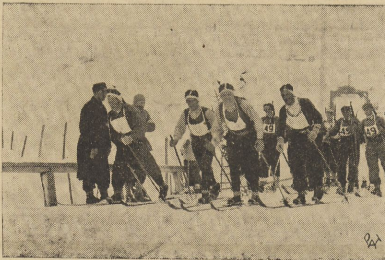
W Worochole odbył się w dn. od 14 do 17 bm. Marsz Huculskim Szlakiem Drugiej Brygady. Udział w marszu wzięło kilkadziesiąt patroli narciarskich i cywilnych. Na zdjęciu — patrole w drodze.