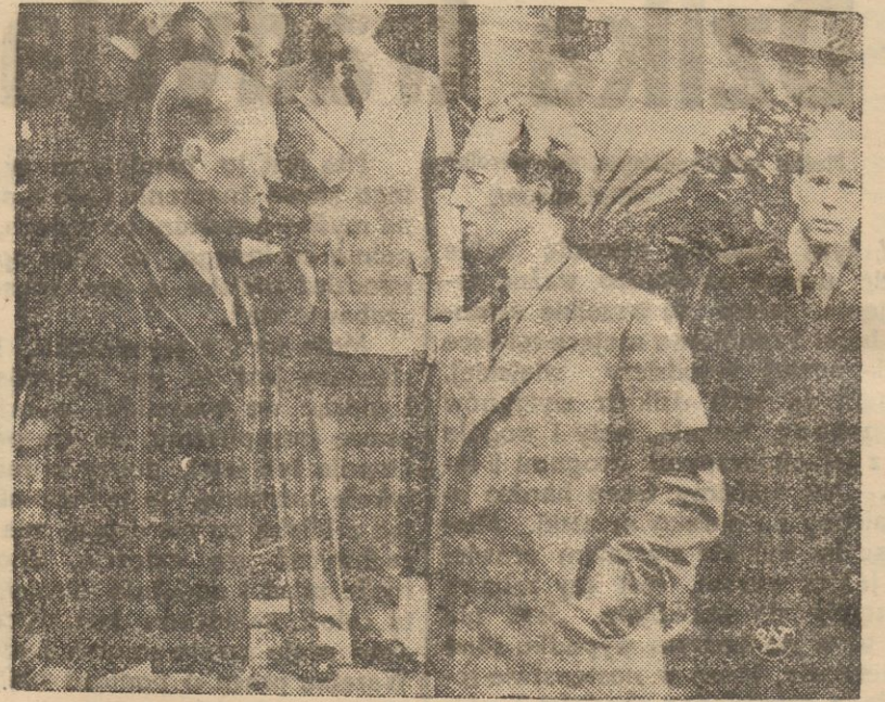
Król belgijski Leopold III rozmawia ze znanym artystą Maurice Chevalier, na placu wyścigowym w Ostendzie.