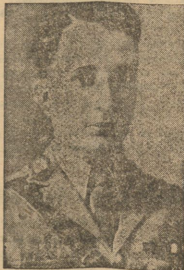
Tragicznie zmarły król Ghazi.

skutek złamania podstawy czaszki i wstrząsu mózgu. Akt zgonu podpisany został przez 5 lekarzy.