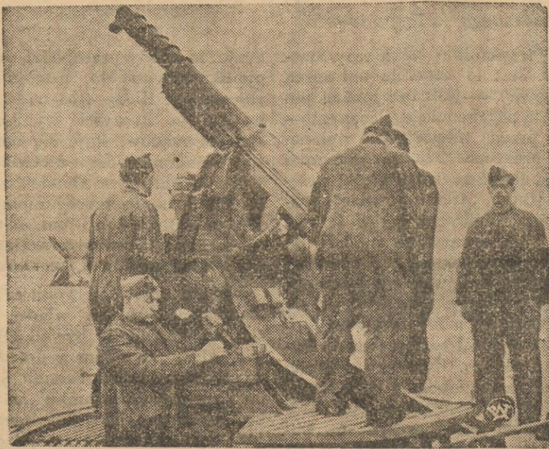
Nowoczesne belgijskie działo przeciwlotnicze, w czasie prób polowych.