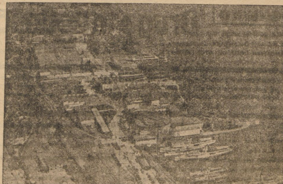
Fragment terenów wystawowych na brzegu jeziora Zurichskiego.