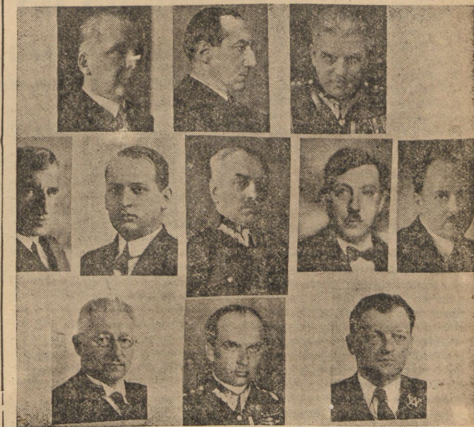
W pierwszym rządzie od prawej ku lewej: min. komunikacji płk. Ulrych, minister spraw zagranicznych płk. Beck, minister poczty i telegrafów inż. Kaliński, drugi rząd — od prawej ku lewej: min. opieki społecznej Kościółkowski, wicepremier i minister skarbu inż. Kwiatkowski, prezes Rady Ministrów — gen. Stawoj Składkowski, minister przemysłu i handlu Roman, minister rolnictwa Poniatowski. Trzeci rząd od prawej ku lewej: minister sprawiedliwości Grabowski, minister spraw wojskowych gen. Kasprzycki, min. wr i op — prof. Świętosławski.

Wczoraj 15 maja przypadła trzecia rocznica mianowania rządu w jego obecnym składzie z premierem Składkowskim na czele. Jest to jak dotąd najdłuższy rządzący w Polsce premier i rząd.