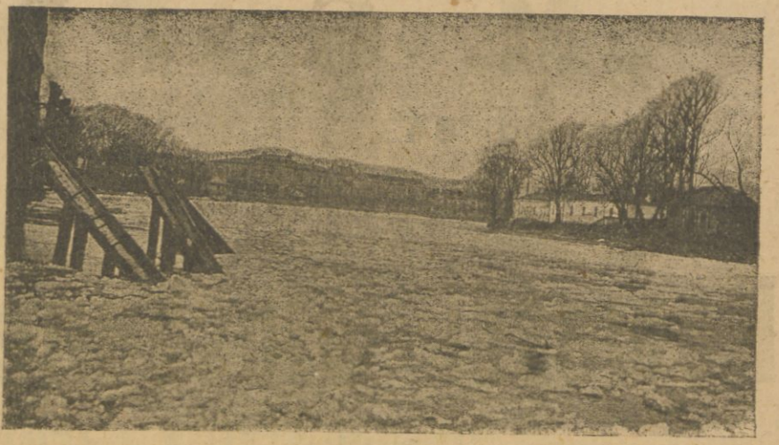
Ostatnia to kra na Wilji.