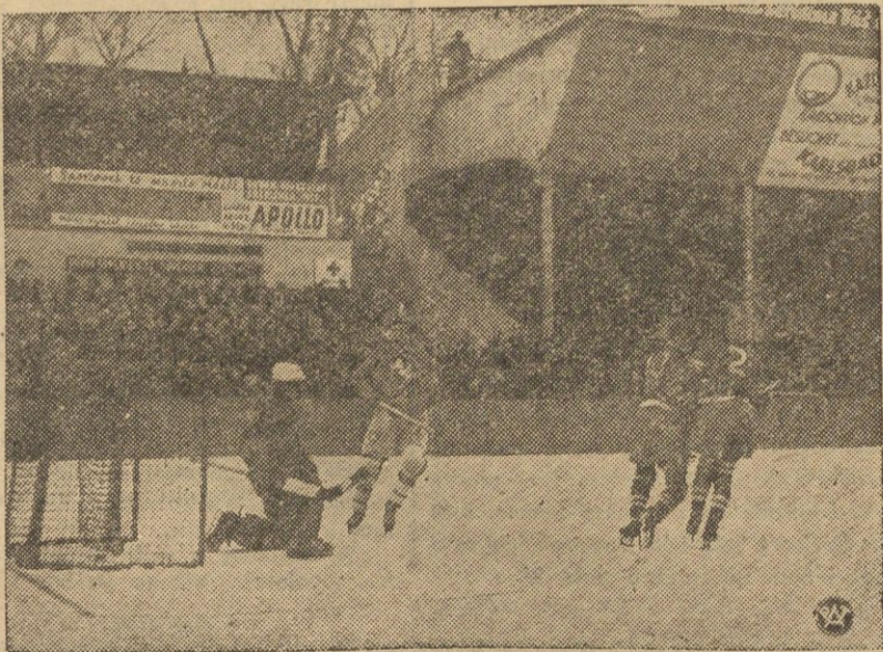
Fragment z meczu hokejowego Polska — Szwajcaria, rozegranego w ramach Międzynarodowych zawodów Hokejowych w Pradze.