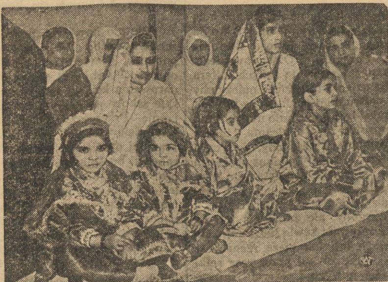
W Londynie odbyły się w tych dniach, zorganizowane przez tamtejszą kolonię wyznawców Islamu, uroczystości Święta Islamu. Na zdjęciu — grupa Indianek z dziećmi, w oryginalnych strojach, podczas Święta Islamu.