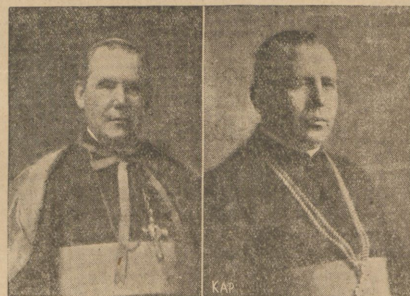
Ks. biskup nominat Józef Gawlina

sko dyrektora Katolickiej Agencji Prasowej w Warszawie, którą zorganizował przy wielkim na kładzie pracy osobistej. Dnia 27 czerwca 1928 r. zdobył tytuł magistra teologii, a w grudniu tegoż roku zostaje tajnym szambelanem papieskim. W roku 1929 wraca do Katowic na stanowisko dyrektora Akcji Katolickiej.