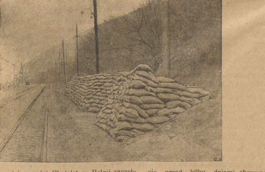
W pobliżu miejscowości Chateau w Belgji zaczęło się przed kilku dniami obsuwać dość wysokie wzgórze, grożąc zasypaniem drogi, wiodącej do tej miejscowości. Na zdjęciu naszym widzimy zapory, mające na celu zapobiec zasypaniu drogi przez zwalę ziemi.