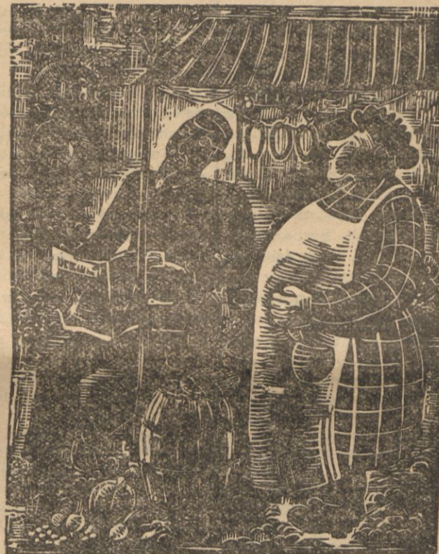
„OSTATNI STRAGAN” PLACYDA SIEDLECKA Drzeworyt, 20x25. Cena 6 zł.