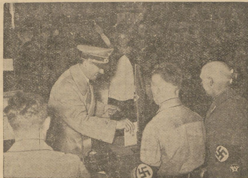
Kancelarz Hitler składa głos w lokalu wyborczym w Berlinie.