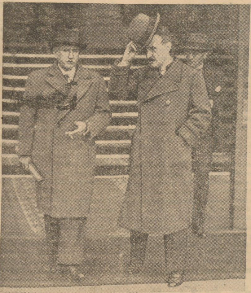
Premier Daladier (po lewej) opuszcza pałac Elizejski w towarzystwie wiceprem Chautemps.

Od lewicy do centrum — Sylwetki ministrów — „Podściółkowy gabinet” — Przelom nie jest zakończony