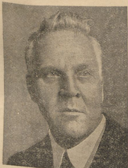
PARYŻ, (Pat). Zmarł sławny śpiewak rosyjski Teodor Szalapin.