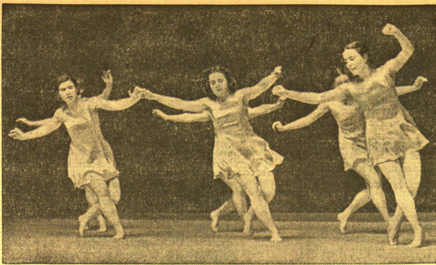
Ein Beispiel für die Schönheit der Gymnastik

In Deutschland wird gegenwärtig eine große Gymnastik-Werbewoche durchgeführt, die die Bevölkerung auf die Bedeutung der gymnastischen Übungen hinweisen soll. Hier sieht man eine charakteristische Gruppe aus der Werbevorbereitung, die die Schönheit der gymnastischen Bewegungen veranschaulicht.