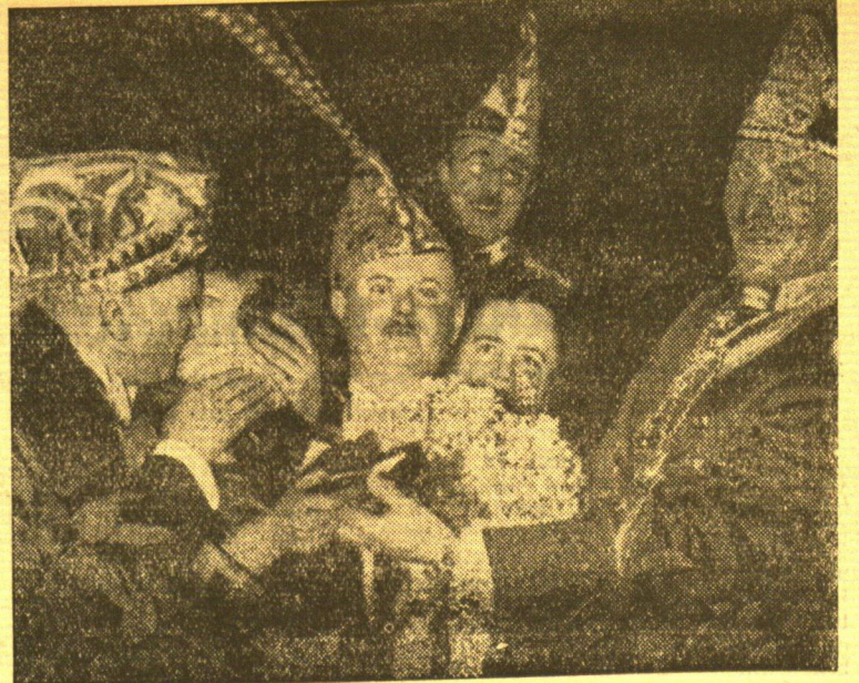
Einen Kuß der „Bohnenkönigin“

In Stockholm kämpften die Frauen um die Weltmeisterschaft im Eisschnelllauf. Die amerikanische Meisterin Kit Klein konnte sich gegen die schwere norwegische Konkurrenz durchsetzen und zum erstenmal die Weltmeisterschaft erringen. In strahlender Freude ließ sich die neue Meisterin im Siegerkranz fotografieren.