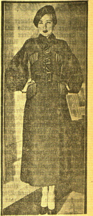
Die Tücherfesten Diese neue Mode- schöpfung erinnert an die Mäntel der Tücher- festen. Eine passende Ruffentappe verleiht dem eleganten Tuch- mäntel, der mit Vesuvianer belegt ist.

damit nicht manches belastete Gemüt noch tiefer, trüben Bitterkeit in das Herz des schwer und vergeblich Ringenden? Selten werden wir unter Fernstehenden auf die gutmütige Seele stoßen, die gern an unserer Freude teilnimmt. Prüfen wir doch auch, ob nicht etwas Selbstbewunderung und Ueberheblichkeit in unsere frohen Berichte, ein gut Teil Wehleidigkeit, abermals eine Form der Eigenliebe, in die Klagen sich einmischt. Stoßen wir dann auf Teilnahmslosigkeit, Spott, Mißverstehen, so möchten wir an der Menschheit verzweifeln. Nein, das tiefe Erleben soll man nur mit Freunden und Ausgewählten teilen, sonst kommt die Stunde, da wir uns schmerzhaft fragen müssen: „Warum erzähle ich es?“ Marie Gerbrandt.