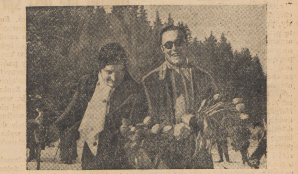
Uśmiechnięta para księżęca z naręczami o trzymany kwiatów.