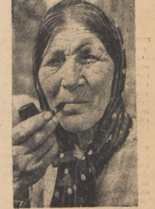
Cyganie są znani jako namiętni palacze fajek. Na zdjęciu widzimy właśnie starą cyganke, jak z rozkoszą pali swoją fajkę, którą się chyba nigdy nie rozstaje.