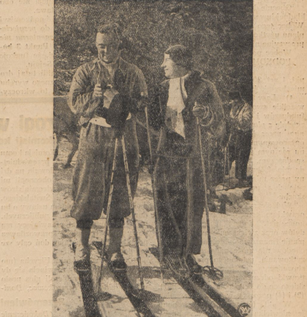
Holenderska para podczas jednej z wycieczek narciarskich.