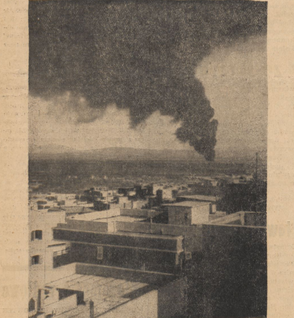
Na zdjęciu widzimy ogromne czarne kłęby dymu, unoszące się z nad palącej się ropy naftowej w Petroleum Company w Iraku.