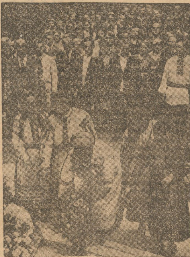
Do stolicy przybyła wycieczka regionalna z ziemi poleskiej w liczbie kilkuset osób, przeważnie młodzieży, w barwnych strojach ludowych. Na zdjęciu moment składania przez poleszuców hołdu pamięci Marszałka Józefa Piłsudskiego w Belwedercze.

trudu dążył do uruchomienia tego gimnazjum.