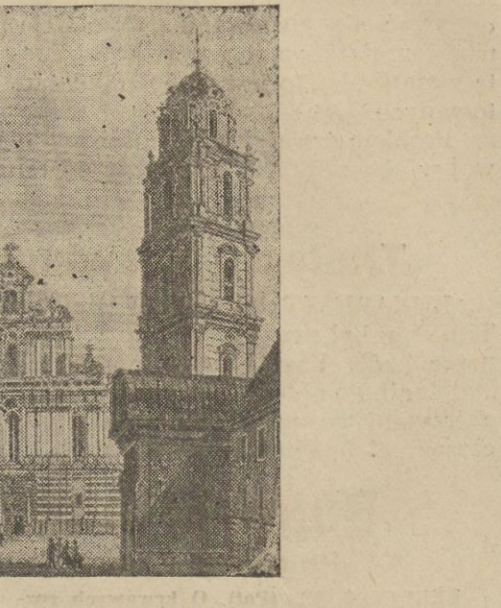
Kościół św. Jana od strony podwórka uniwersyteckiego, według sztuczki z połowy XIX w.