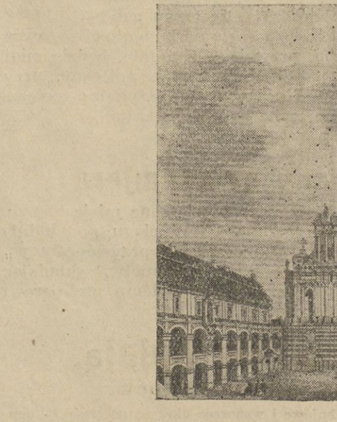
Kościół św. Jana od strony podwórka uniwersyteckiego, według sztuczki z połowy XIX w.