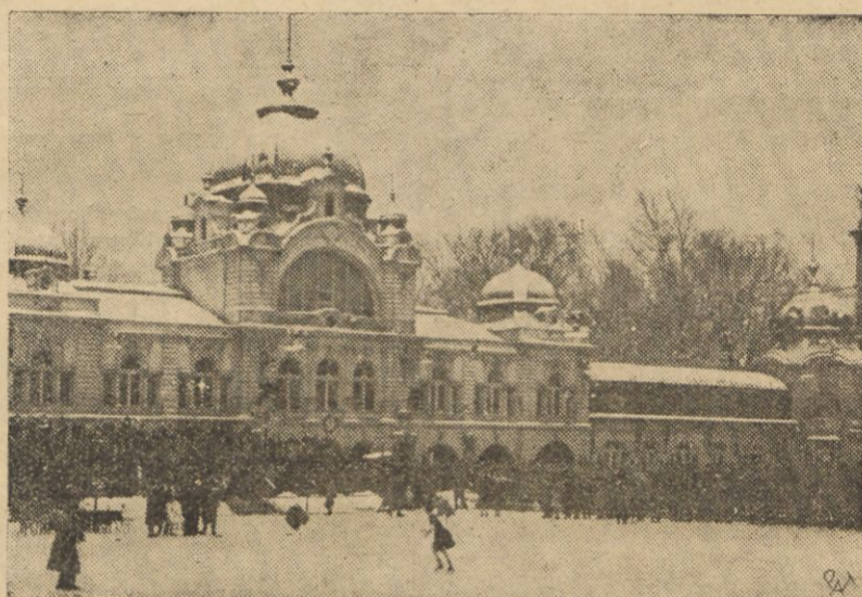
W Budapeszcie rozpoczęły się międzynarodowe mistrzostwa łyżwiarskie z udziałem m. in. z wodników polskich. Na zdjęciu — moment startu zawodników.