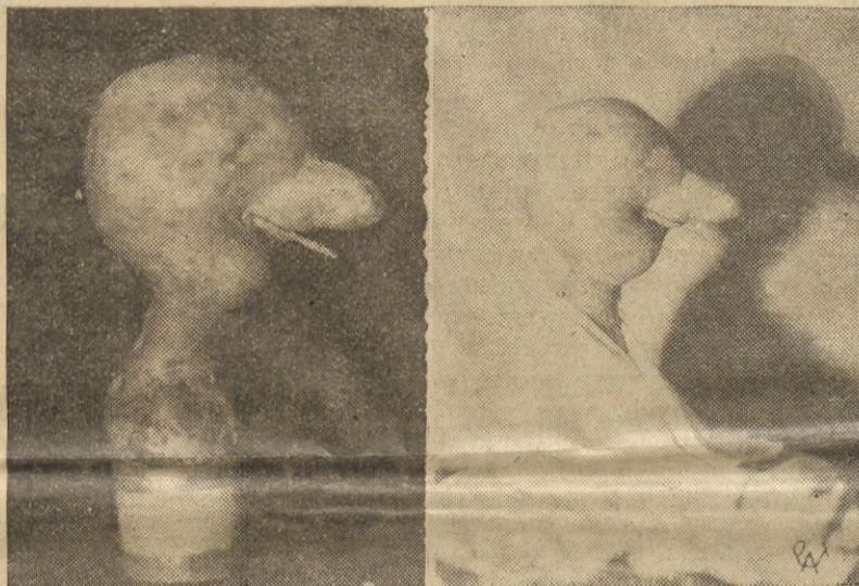
Niezwykły okaz ziemniaka, odkopany w pow. grodzieńskim. Ziemniak ten kształtem swym przypomina maskę Gandhiego, co jeszcze silniej zostało uwidocznione przez osadzenie ziemniaka na „tulowiu”.