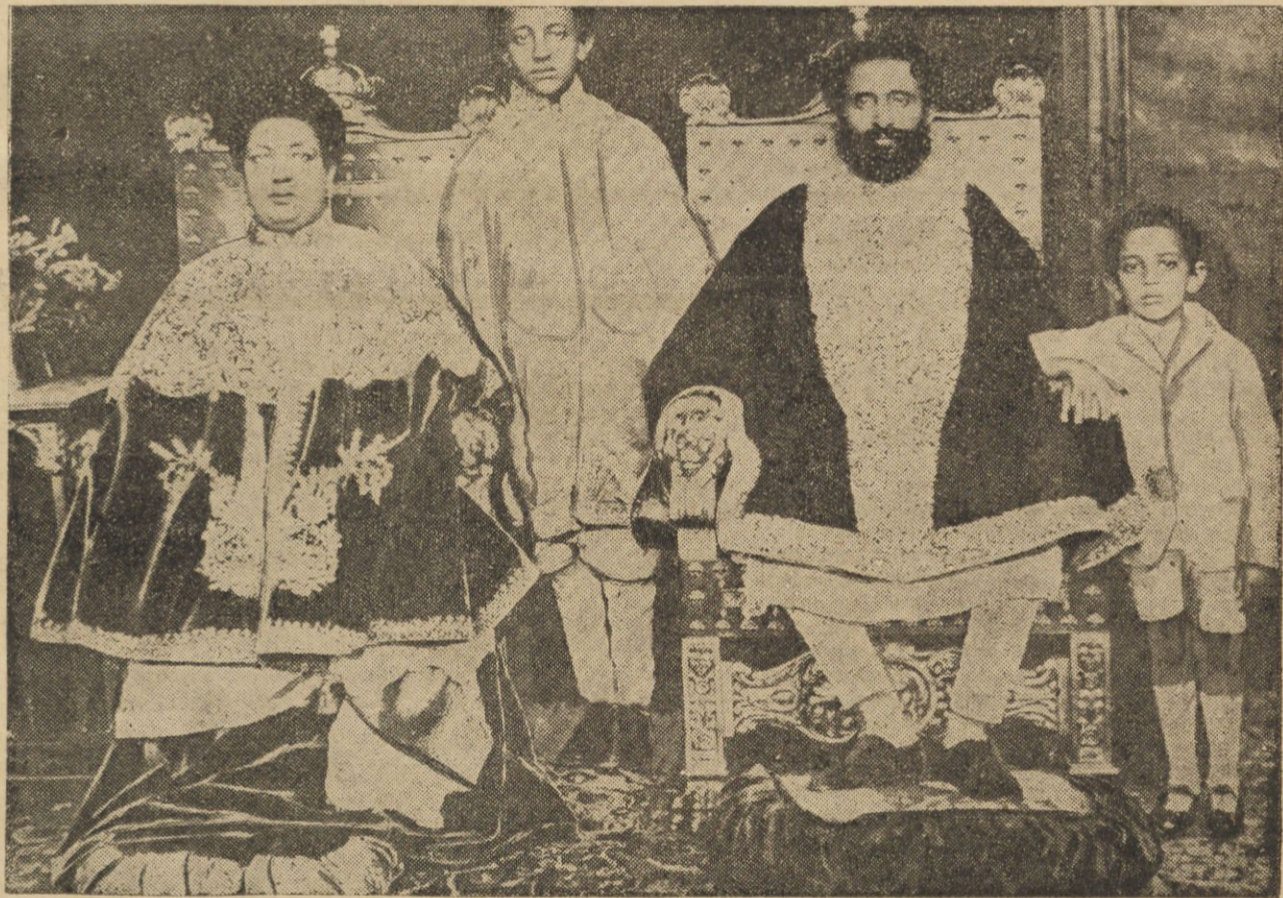
Cesarz Abisynji Halle Selassie i jego rodzina