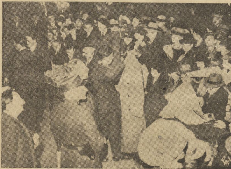
Wyprzedz na licytacji w Paryżu rzeczy należących do Stawiskiego.