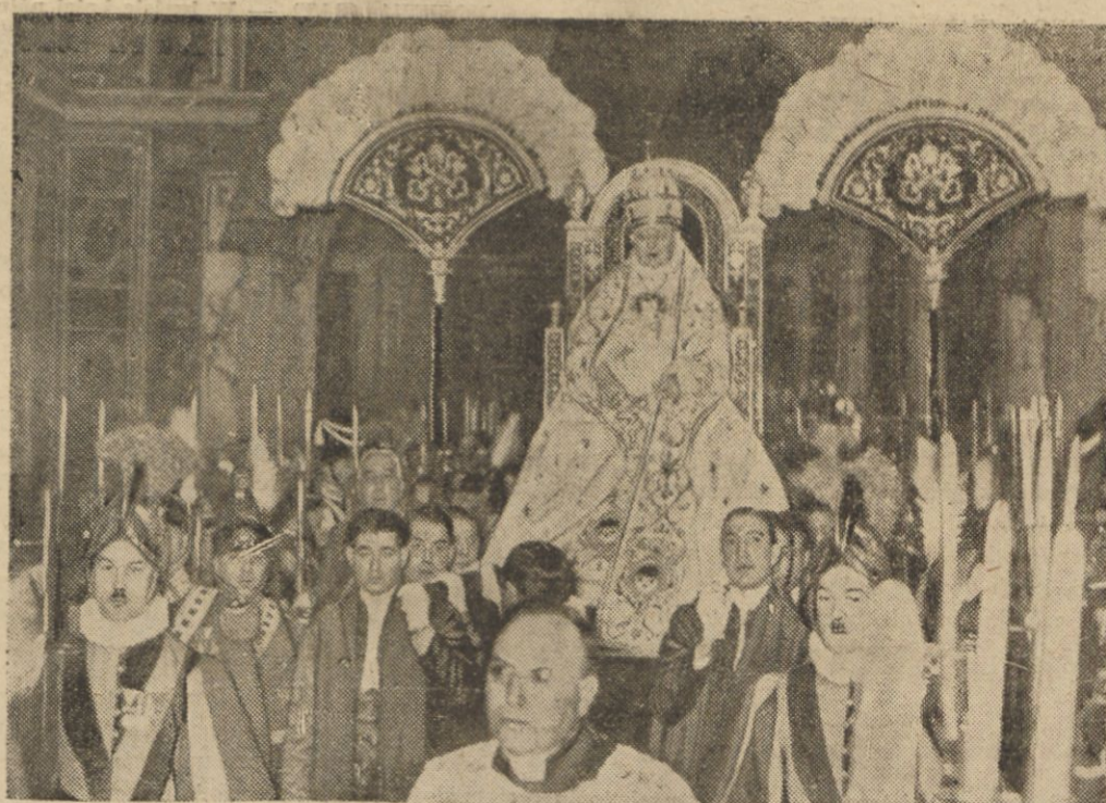
Papież Pius XI na tronie, w szatach pontyfikalnych, niesiony do bazyliki św. Piotra i Pawła w Rzymie, w dniu jubileuszu koronacji.