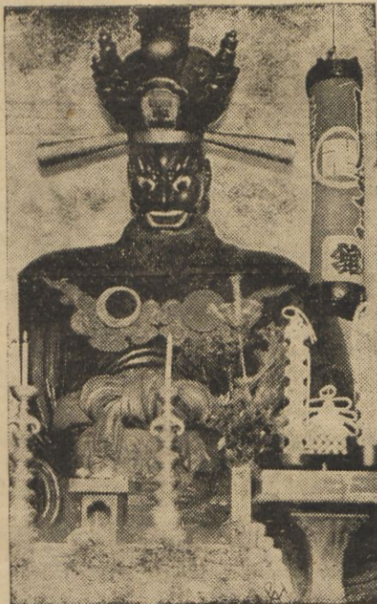
Posąg „władcy piekła“ Emma - Sun znajdujący się w jednej ze świątyń tokijskich.