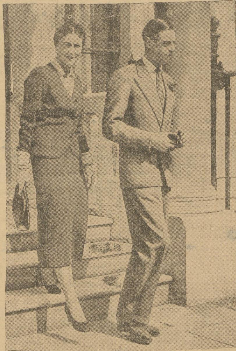
Książę Kenlu z żoną w podróży po Europie zatrzymali się w Austrii, gdzie odwiedzili księcia Windsoru.

row, stawiających socjalistyczne folanstery rolne ponad kolchozami, czyli rodzajem chłopskich spółdzielni rolnych, mogących być organizowanymi nawet w każdym państwie kapitalistycznym. Stalin rzuca nawet hasło zrobić „wszystkich kolchozników zamożnymi”, zaopatrzyć „każdego kolchoznika we własną krowę” i t. d. A począwszy od wiosny 1935 roku występuje już z inicyatywą likwidacji nierentownych sowchozów. I tak aż do wiosny 1937 roku włącznie jest już zlikwidowanych ca 70 proc. wszystkich sowchozów. Są już republiki jak Gruzja, Armenia, a obecnie Białoruś w których nie pozostało żadnego sowchozu.