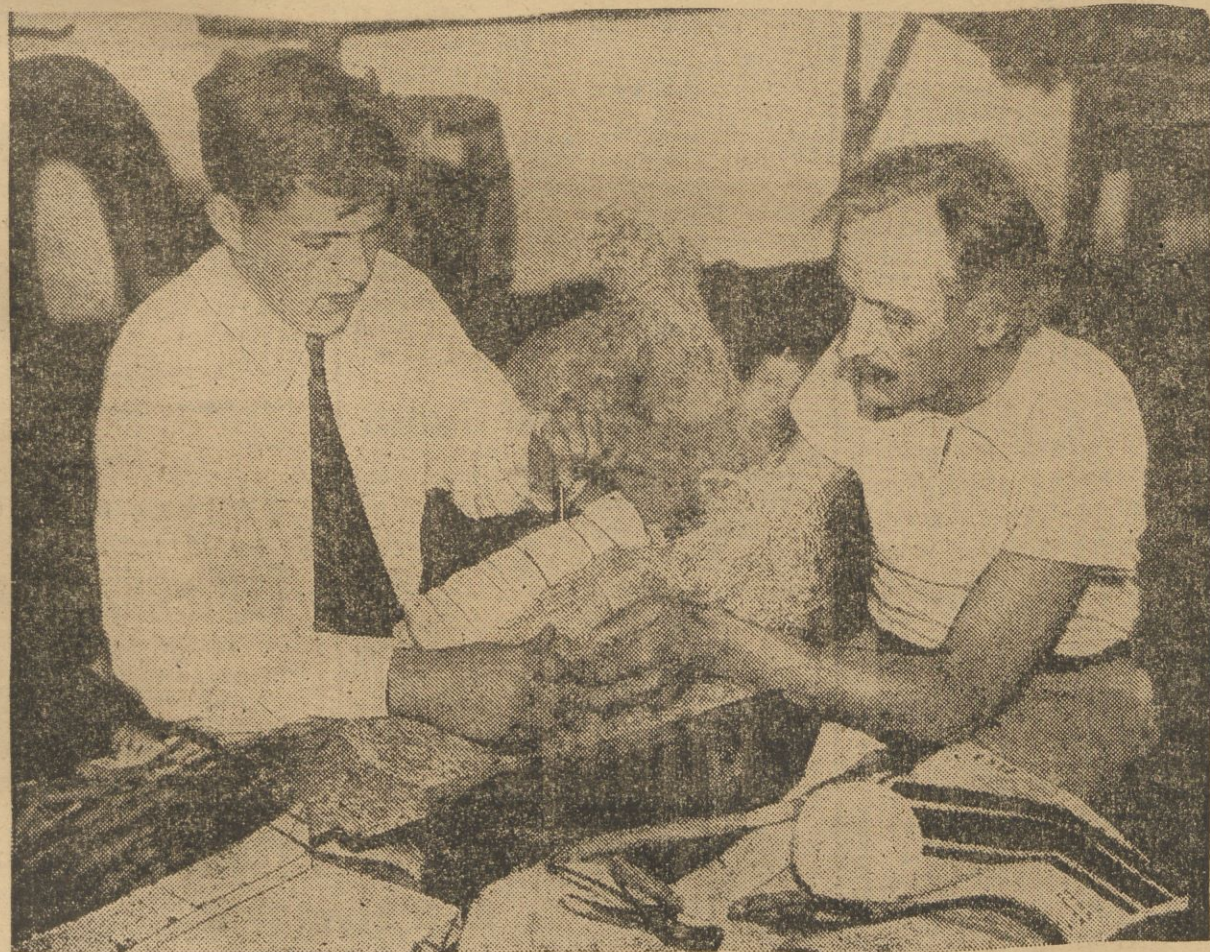
Prof. Piccard zamierza odbyć lot do stratosfery na balonie, złożonym z 2000 małych baloników. Na zdjęciu — prof. Piccard ze starszym synem podczas pracy nad przygotowaniem do lotu.