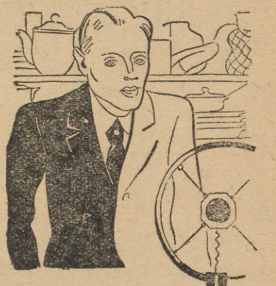
W KAŻDĄ ŚRODĘ O GODZ. 21.50