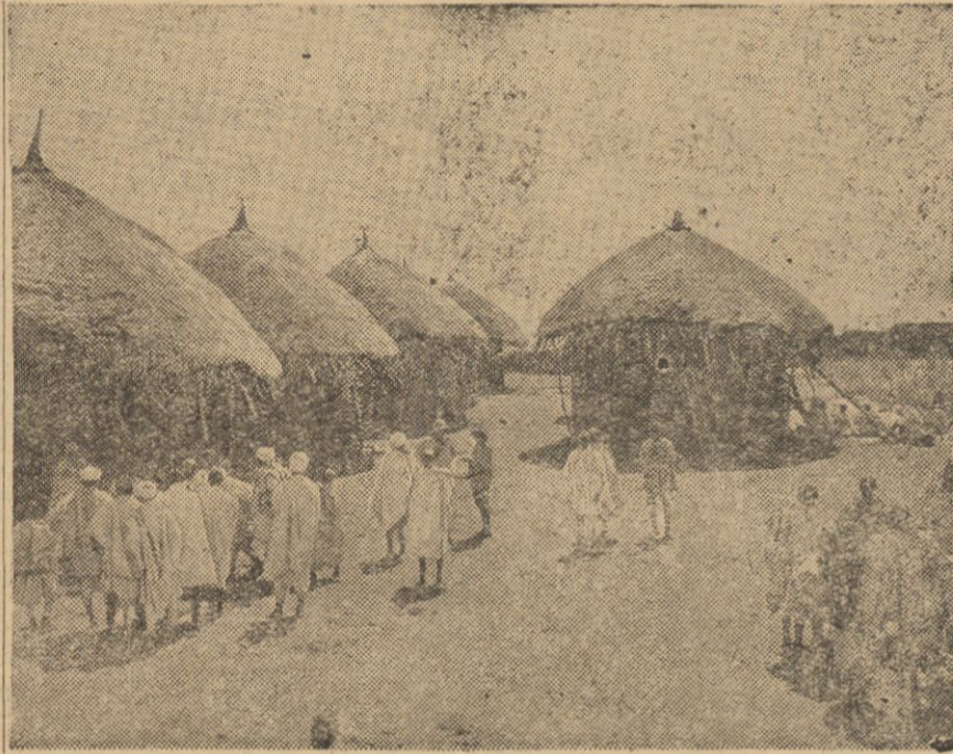
Jedna z wsi abisyńskich zajętych ostatnio przez wojska włoskie.

A więc Seyum — abisyński Kmiecic — w przebraniu szykuje dywersję na tyłach zalewającego kraj wroga. Włosi wyznaczili bodaj nagrodę za unieszkodliwienie groźnego partyzanta.