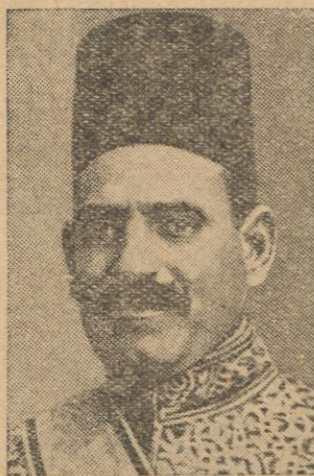
Nahaas Pasza, przywódca nacjonalistów egipskich.

eniające potęgę Wielkiej Brytanji w Egipcie, zaniepokoiły nacjonalistów egipskich, bowiem czynią niepodległość Egiptu jeszcze bardziej iluzoryczną, niż jest ona w istocie.