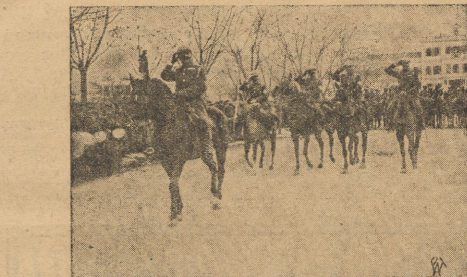
Wymarsz wojsk rządowych greckich do okręgu Ceres.

SOFJA. (Pat). Wedle wiadomości o- trzymanych z pogranicza grecko - buł- garskiego, na całym terytorjum opano- wanym przez powstańców ogłoszono mo- bilizację 18 roczników. Powołano więc