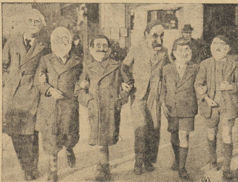
Maski aktualnych osobistości politycznych niesione na ulicach Paryża w czasie ostatnich. Wśród masek rozpoznamy: (od lewej) Paul Bancoura, Cheron, Tardieu, Bluma, Herriota i Hillera.