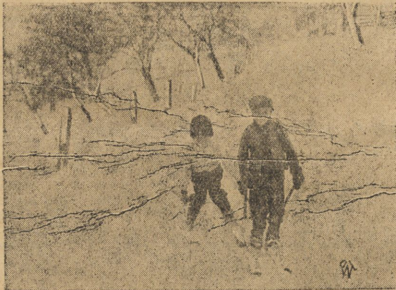
Zanim słońce śniegi roztopi dzieci huculskie korzystają z rozkoszy nart.

w tem błocie. Całe szczęście, że we wsi wiec dostaliśmy wiadro z wodą, no i była uciecha chłopów obserwować, jak memu chłopcu kibicowali i pomagali przy robocie.