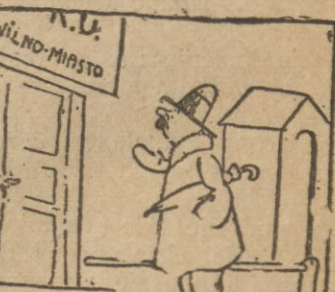
Kiedy dziad służywał w armji, Ma dowiedzieć się co tchu. Trzeba zdobyć cenne dane, Szubie więc do PKU.

Słońce poranne rzuca nieśmiałe promienie. Jasno tu i wesoło. Inny świat. W.T.