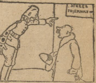
Tu pan sierżant się rozgniewa. Krzyknie niby dziki zwier. — Patrz tablica napisana, Tajemnicy wojska strzeż.