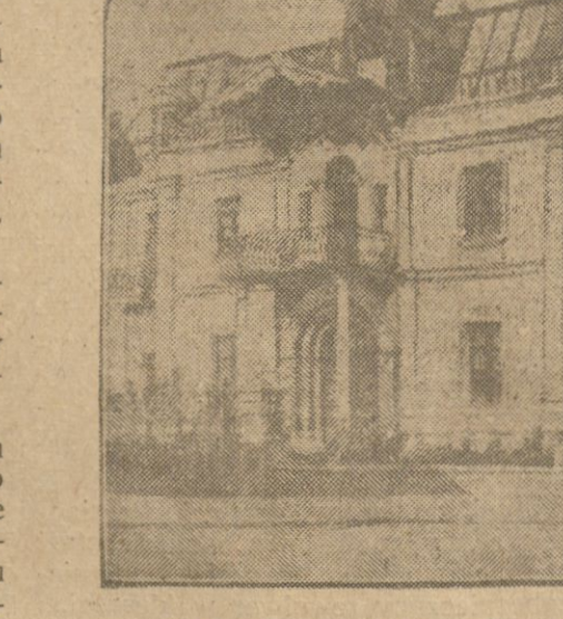
Pałac prezydenta Macandy zrujnowany przez trzęsienie ziemi.

i medykamentów dla rannych, wydobytą z pod gruzów, nie została zakończona i potrawa zapewne jeszcze dni kilkanaście. Liczba wydobytych trupów przekracza już cyfrę 5000 osób czyli, że co siódmy mieszkaniec Managui został zabity. Liczba rannych