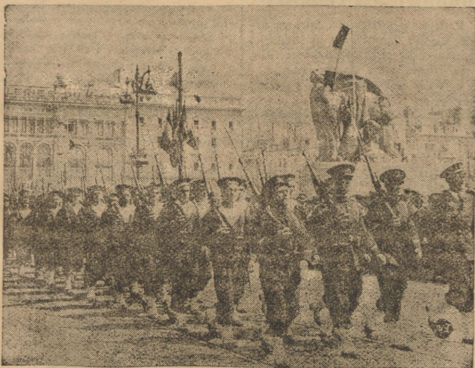
W porcie Le Havre odbyła się uroczystość ku uczczeniu pamięci oficerów i żołnierzy francuskiej marynarki wojennej, którzy ponieśli śmierć w zatopionej na Morzu Chłódzkiej łodzi podwodnej „Phoenix”. Na zdjęciu — oddziały marynarki wojennej defilują przed pomnikiem poległych w Havrze, oddając hołd pamięci swych zmarłych na posterunku kolegów.