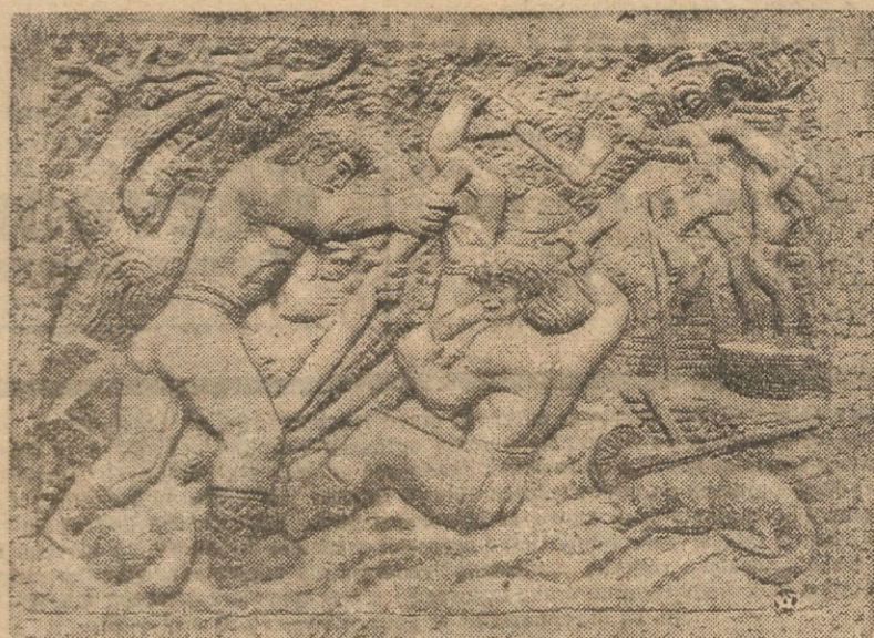
Józef Klukowski — płaskorzeźba — pierwsi emigranci polscy w Ameryce.

— Kwesta uliczna. Towarzystwo Opieki nad Więźniami Patronat Oddział w Lidzie przeprowadził kwestę uliczną w Lidzie 4 bm. W wyniku zebrano 94 zł 91 gr. Kwota powyższa została przeznaczona na pomoc rodzinom biednych więźniów.