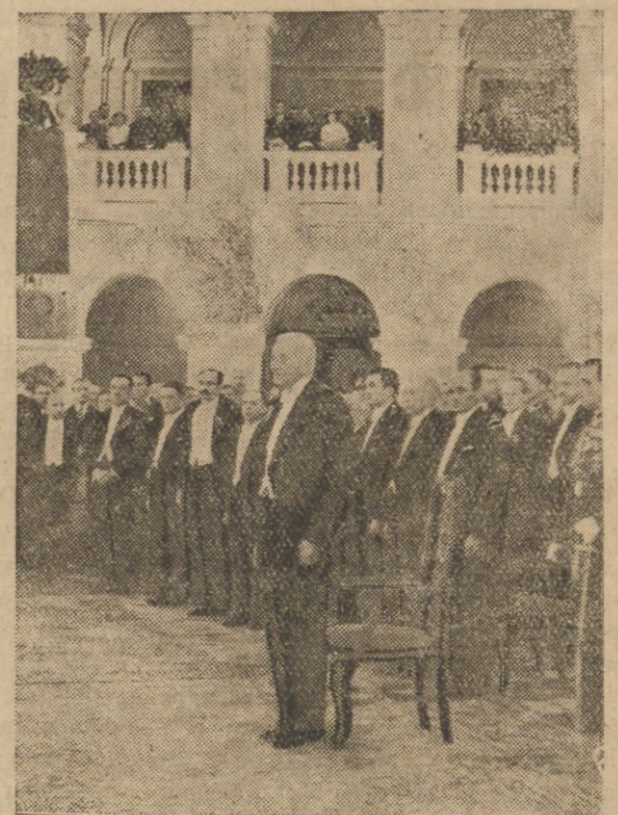
Otwarcie Legjonowego Instytutu Studjów w wielkim hallu Politechniki w obecności Pana Prezydenta Rzeczypospolitej prof. Mościckiego i obecnych w Warszawie członków rządu